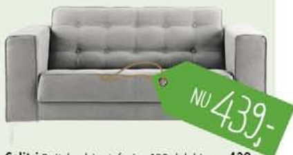
Calitri 2-zitsbank in stof mine 180-dolphin, nu 439,-