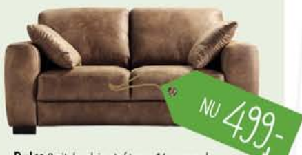
Dulce 2-zitsbank in stof texas 16-caramel, HR schuim, nu 499,-