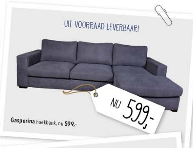
Gasperina hoekbank, nu 599,-