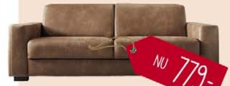
Moletti 4-zitsbank in "leder" gazelle vintage cognac, nu 779,-