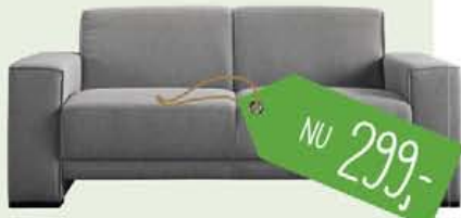
Casciano 2-zitsbank in stof board antraciet, nu 299,-