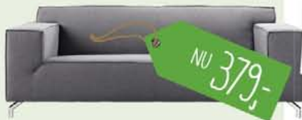
Daiano 2-zitsbank in stof board 68-dark grey, nu 379,-