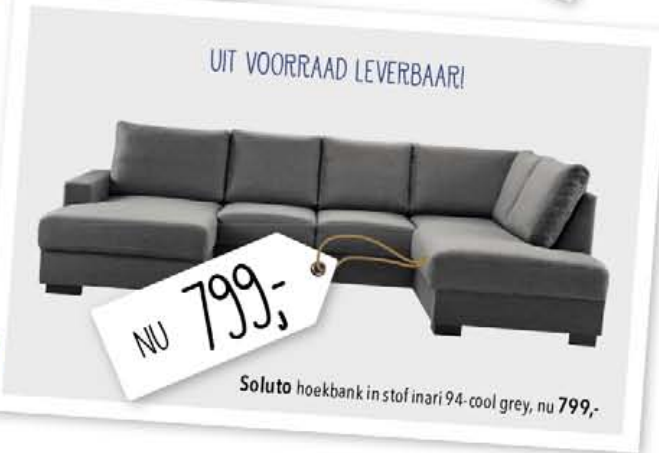
Soluta hoekbank in stof inari 94-cool grey, nu 799,-