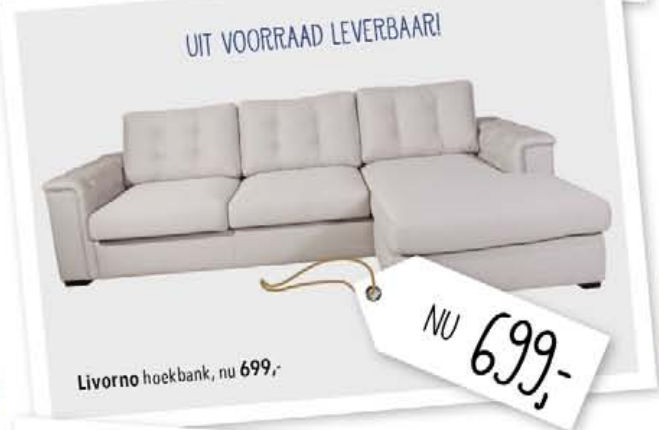
Livorno hoekbank, nu 699,-