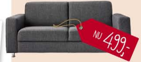
Napoli 3-zitsbank in stof fast 67-antraciet, nu 499,-