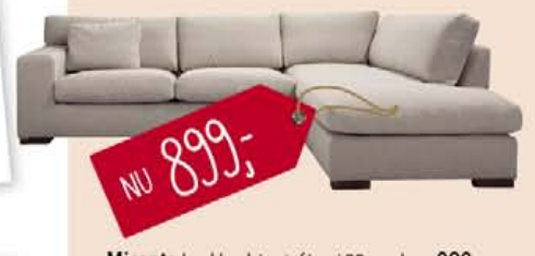
Micanto hoekbank in stof inari 22-sand, nu 899,-