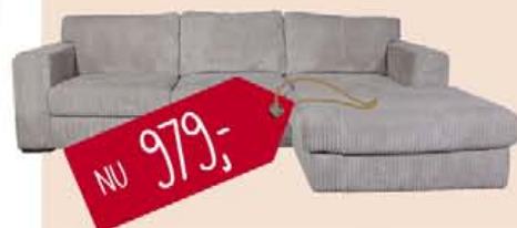
Ferentino hoekbank in ribcord, nu 979,-