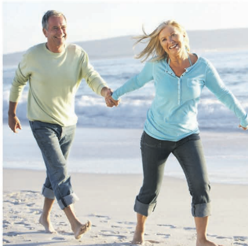
(A-beelding geïnspireerd door getroffen personen)

Kijimea Prikkelbare Darm bevat een wereldwijd unieke bifido-bacteriestam B. bifidum MIMBb75 (uitsluitend in Kijimea Prikkelbare Darm) die zich rechtstreeks aan de darmwand hecht en deze net als een pleister beschermt. De effectiviteit van deze bifido-bacteriestam is aangetoond: de typische symp-