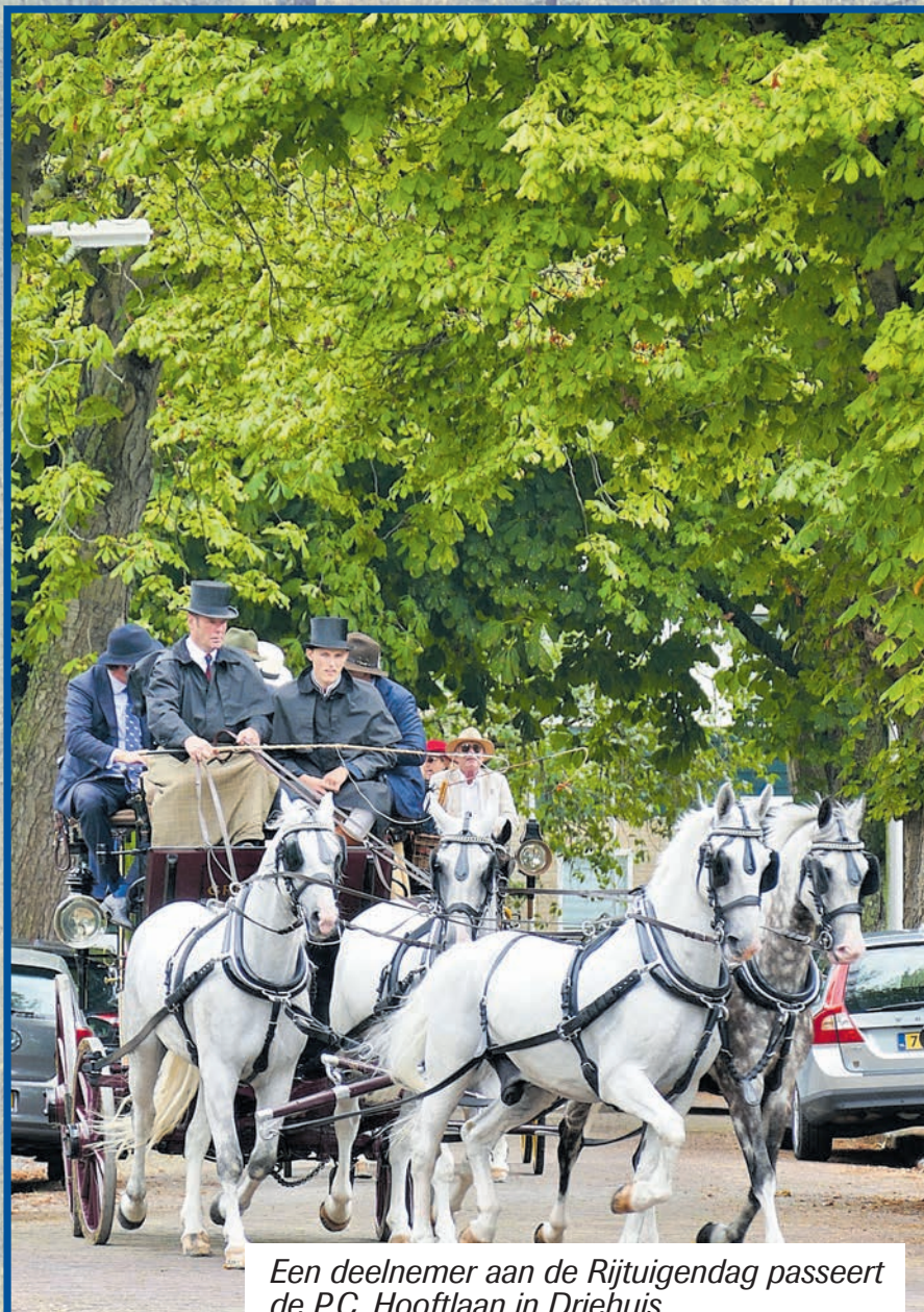
Een deelnemer aan de Rijtuigendag passeert de P.C. Hooftlaan in Driehuis