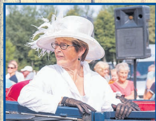
Veel deelnemers aan de Rijtuigendag hadden zich in stijl gekleed