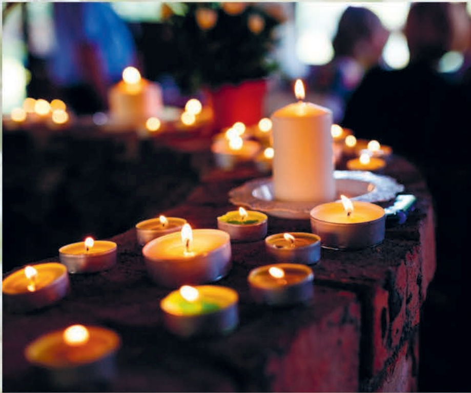
Er is geen goede of slechte manier van rouw verwerken bij het verlies van een kind. (foto aangeleverd)