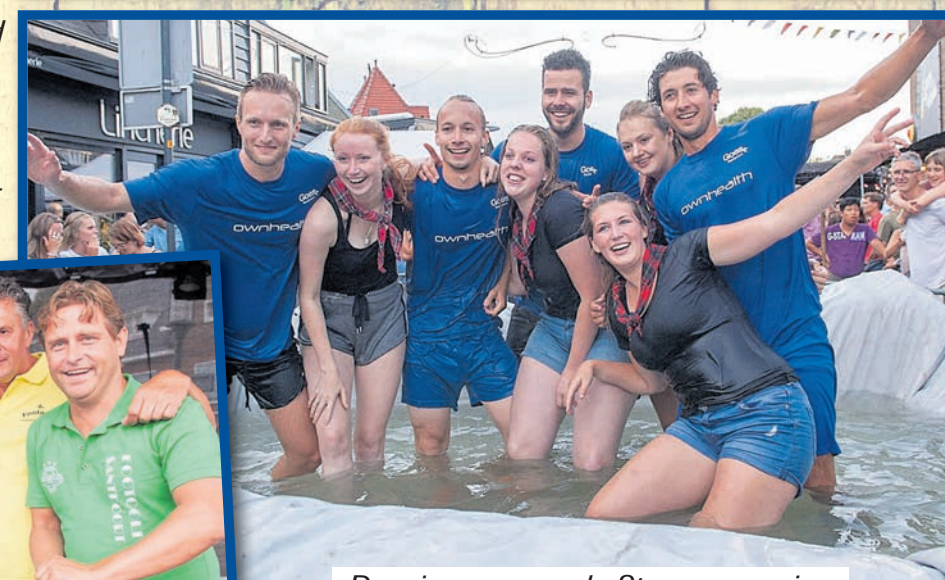
De winnaars van de Steppenrace in de beroemde waterbak