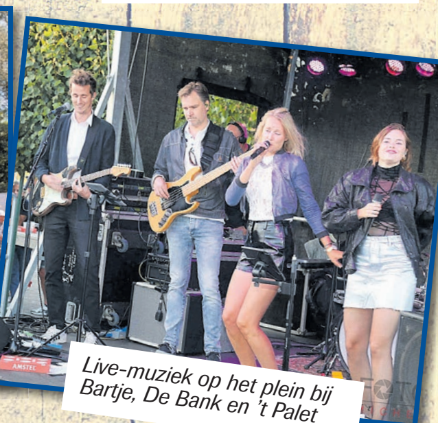
Live-muziek op het plein bij Bartje, De Bank en 't Palet