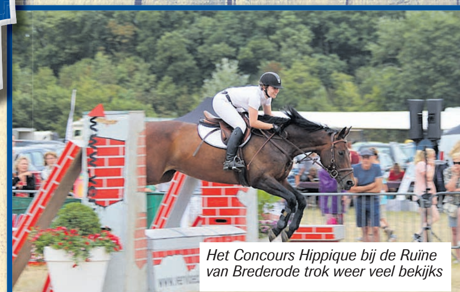
Het Concours Hippique bij de Ruïne van Brederode trok weer veel bekijks