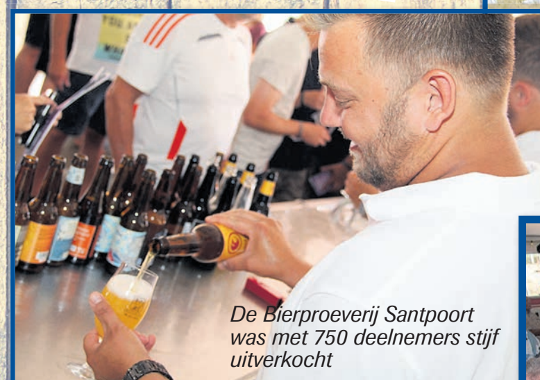
De Bierproeverij Santpoort was met 750 deelnemers stijf uitverkocht