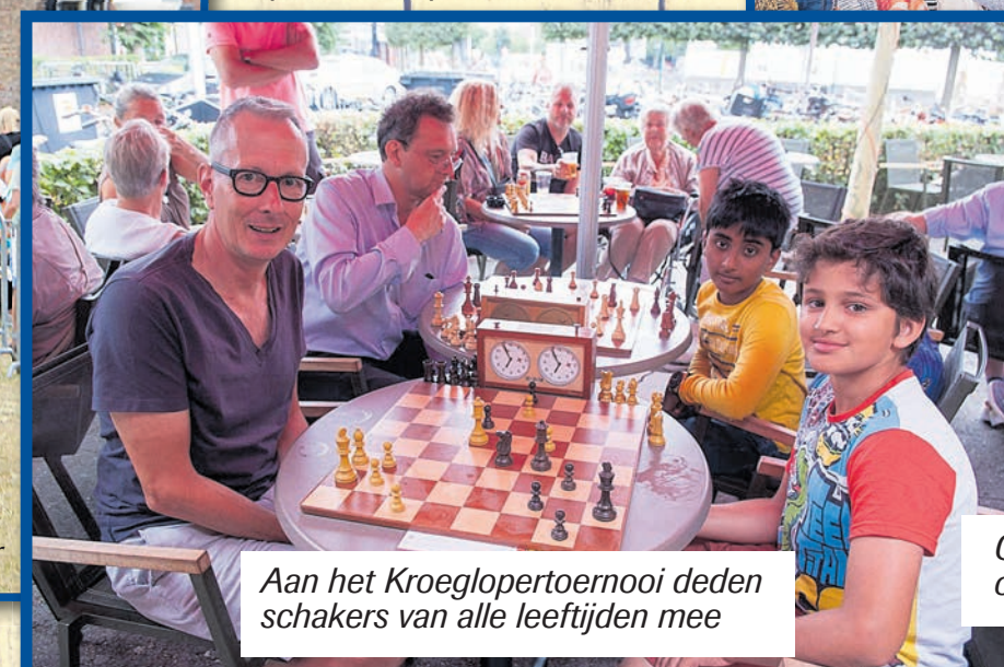
Aan het Kroeglooptoernooi deden schakers van alle leeftijden mee