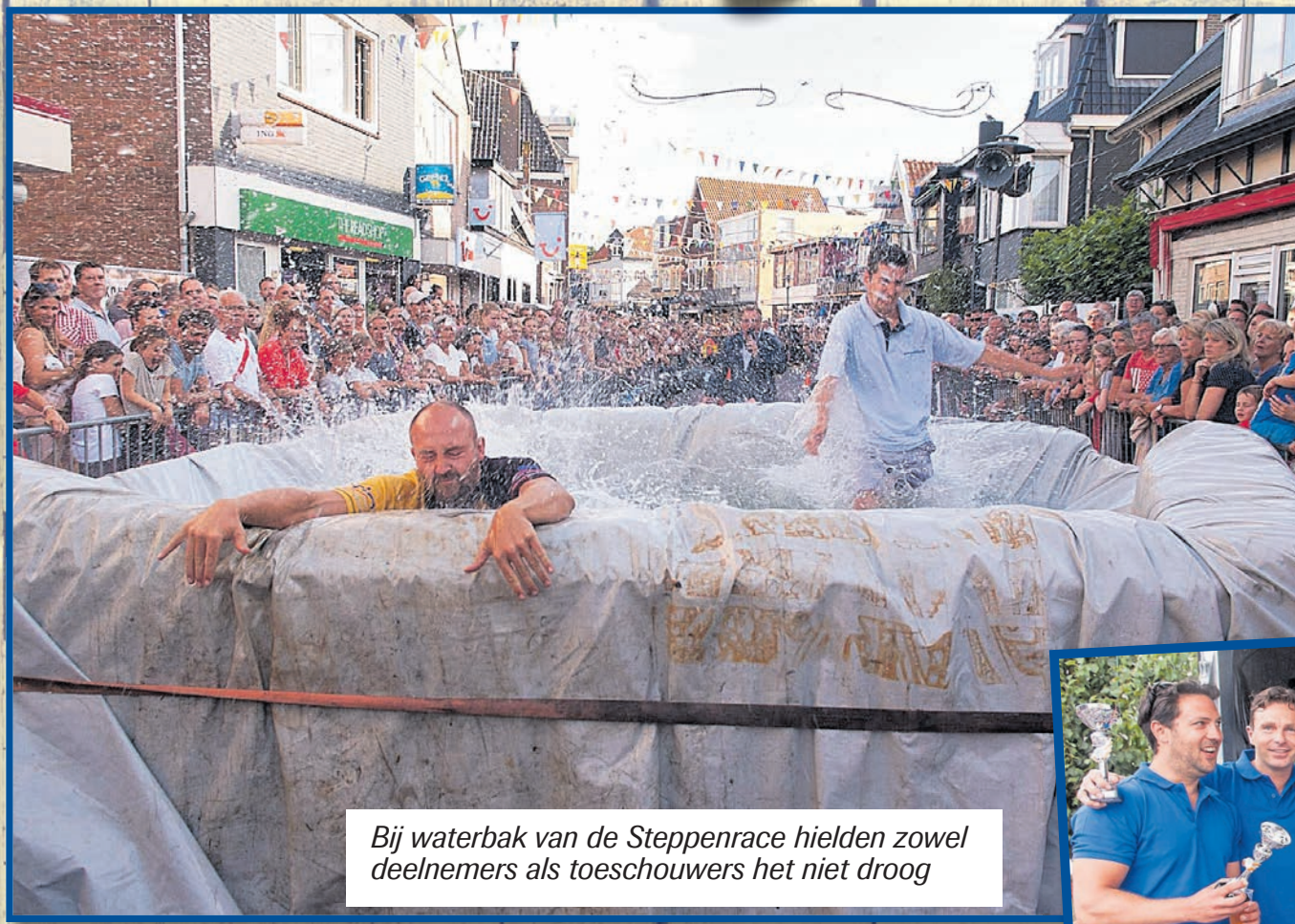
Bij waterbak van de Steppenrace hielden zowel deelnemers als toeschouwers het niet droog