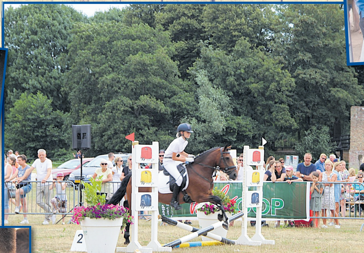
Spanning op het gezicht bij mens en dier