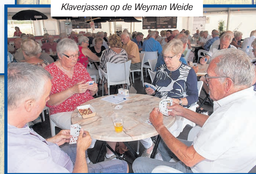
Klaverjassen op de Weyman Weide