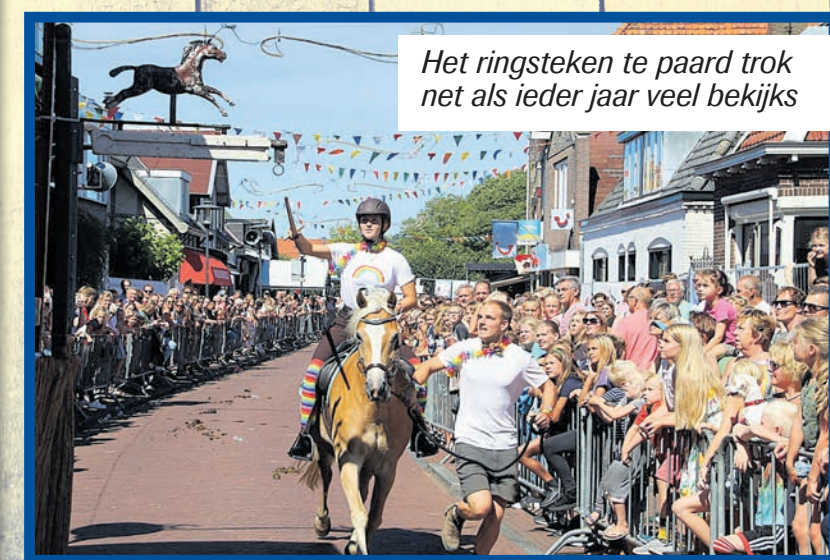
Het ringsteken te paard trok net als ieder jaar veel bekijks