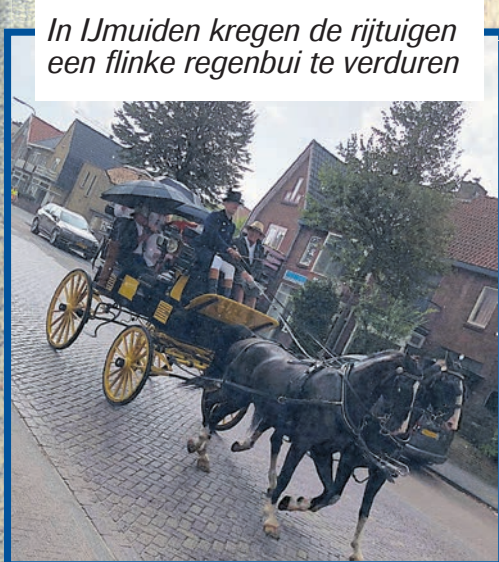
In IJmuiden kregen de rijtuigen een flinke regenbui te verduren