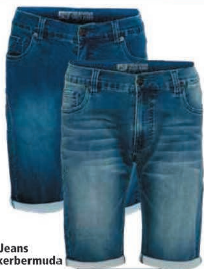
247 Jeans spijkerbermuda Elm Stretchkwaliteit. Taillematen 31 t/m 38.