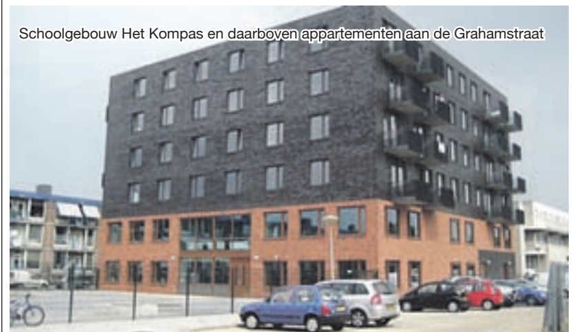
Schoolgebouw Het Kompas en daarboven appartementen aan de Grahamstraat

speelplein aangelegd. Die liggen tussen de Komeet, de hofwoningen en het Moerbergplantsoen vanaf de rotonde naar het noorden tot het voetpad. Naar verwachting is dit eind 2011 gereed. Zo blijft er nog ruimte over om later nieuwe woningen te bouwen, waarbij het bouwverkeer vanaf het Moerbergplantsoen kan rijden. De herinrichting van het noordelijke deel van het park is gekoppeld aan de verkoop en bouw van de hofwoningen van fase 4. De afronding van het zuidelijke deel van het park is gekoppeld aan de totstandkoming van de hof- en de parkwoningen van fase 5. Wanneer deze woningbouwlocaties gerealiseerd worden, is op dit moment nog niet duidelijk.