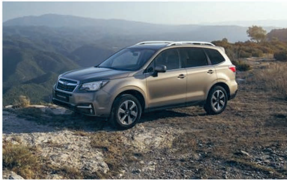
De vernieuwde Forester is leverbaar als Comfort, Luxury en Premium. (foto aangeleverd)

De combinatie van diverse camera's, voor-, knie-, zij- en gordijnairbags, X-mode met Hill Descent Control, permanente vierwielaandrijving, Vehicle Dynamics Control, boxermotor en andere typische Subaru-voorzieningen, maken de Forester de veiligste SUV in zijn klasse. Onafhankelijke botsinstanties