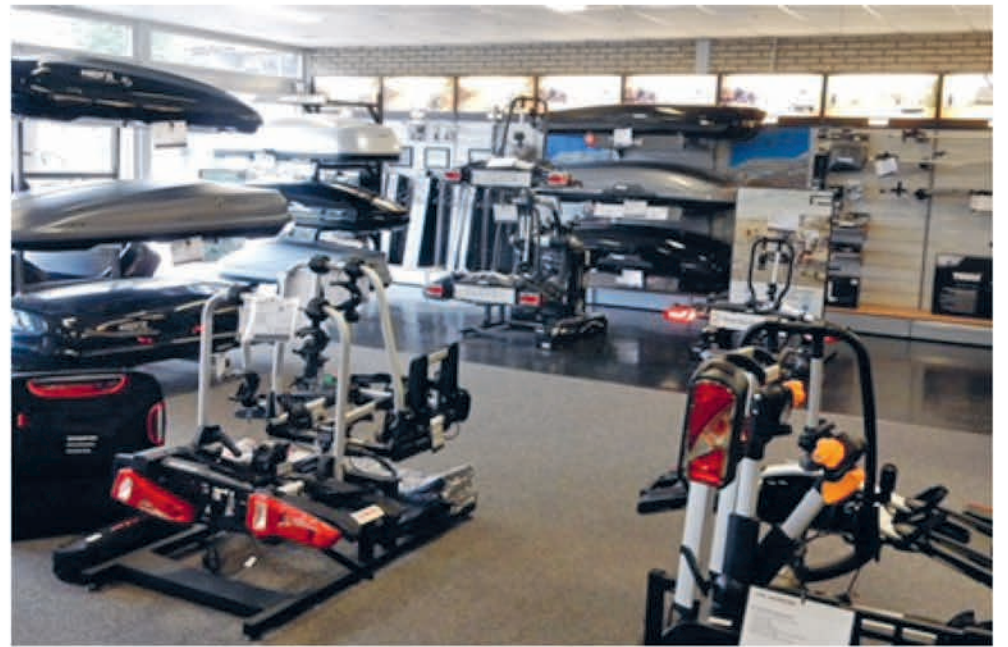
Ook kunt u bij Jim Barens OTOTOTAAL terecht voor het laten inbouwen van parkeersensoren.

Heeft u nog geen trekhaak? Jim Barens OTOTOTAAL is uw trekhaakspecialist en is al jaren een gecertificeerd montage partner. Als Brink montage partner bent u bij hen aan het juiste adres voor het monteren van een trekhaak onder uw voertuig. Of u nu een trekhaakoplossing zoekt voor een fietsendrager, aanhanger of caravan, met het grootste assortiment is er altijd een geschikte trekhaak voor uw auto. Ook voor hybride en elektrische auto's zijn trekhaken leverbaar. Wilt u tevens comfortabel rijden en ontspannen op uw bestemming aankomen, dan kunt u er voor kiezen om een cruisecontrol te laten inbouwen. Jim Barens OTOTOTAAL levert en monteert deze persoonlijke snelheidsassistent. Met een druk op de knop stelt u de gewenste snelheid in, zodat uw voet van het gaspe-