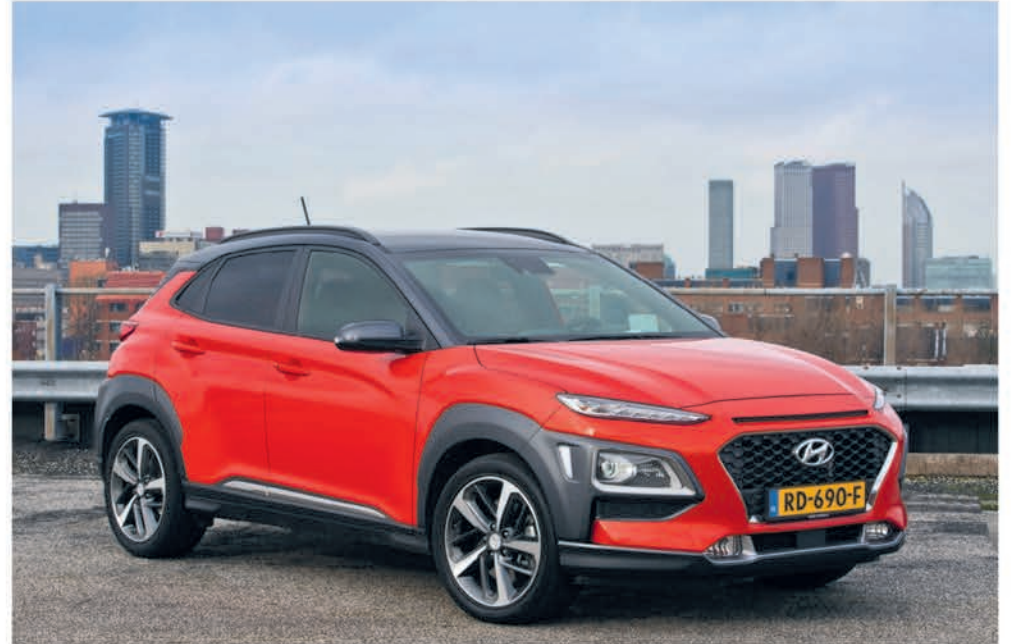
Hyundai KONA.

Alle modellen van Hyundai, en dus ook de Tucson, KONA en ix20 bezitten immers de hoogste kwaliteit materialen, doorstaan de allerzwaarste testen en worden door miljoenen tevreden mensen gereden. Over de hele wereld. Iedere dag. Toch moet het een prettig idee zijn. Dat waar u ook bent, Hyundai er altijd voor u is. Deze belofte maakt Hyundai waar in de vorm van die 5 driedubbele garantie. Met snelle reparaties, vervangend vervoer, transport, oliechecks u kunt het zo gek niet verzinnen. En dat allemaal gratis. 5 jaar lang. -5 jaar Garantie zonder KM-beperking: Bumper tot bumper. Hyundai staat voor de totale garantie.