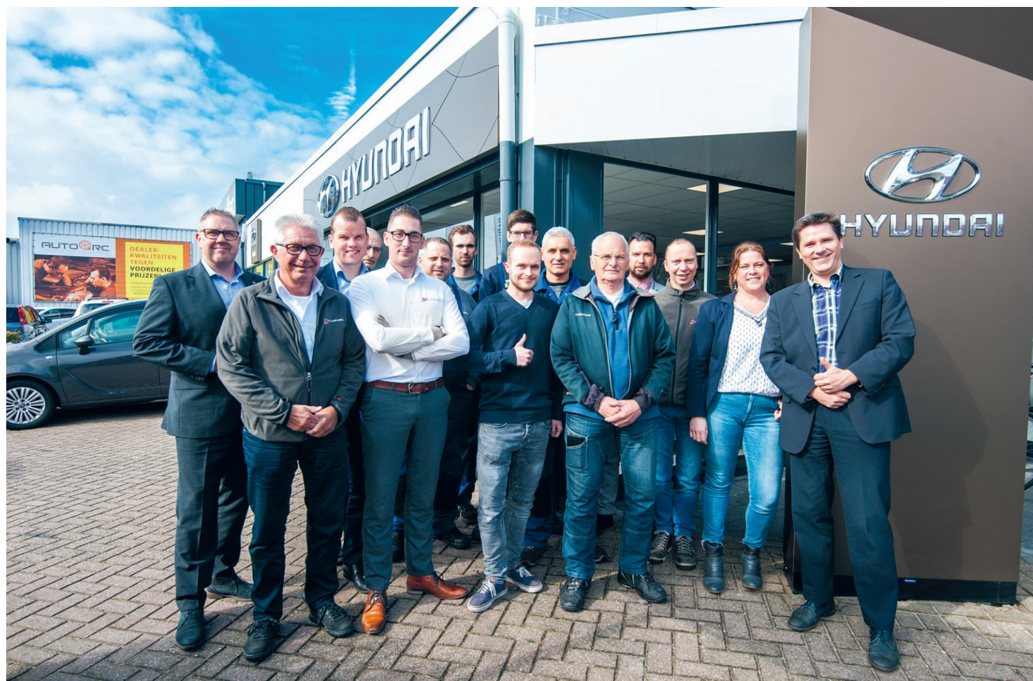
Het team van Hyundai Velsersbeek.

Wie zich wil oriënteren en nog niet precies