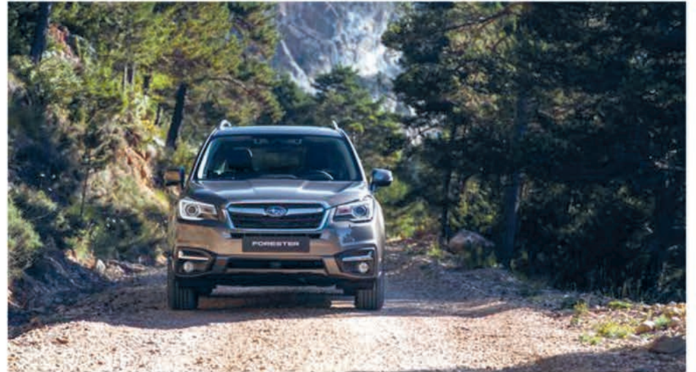
Subaru wil per 2020 het veiligste merk ter wereld zijn.

Subaru Kennemerland, Eysinkweg 67, 2014 SB Haarlem. Telefoon: 023- 5531000, www.kennemerland.subaru.nl .