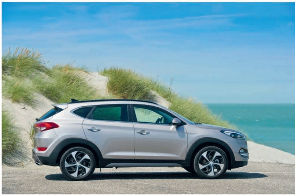
Hyundai Tucson.

Deze unieke service stopt niet na 50.000 of 500.000 km. Wel na 5 jaar. -5 jaar Mobiliteitsgarantie: Gratis reparatie is mooi maar helpt u niet altijd verder op weg als u toevallig in het buitenland bent. Daar-