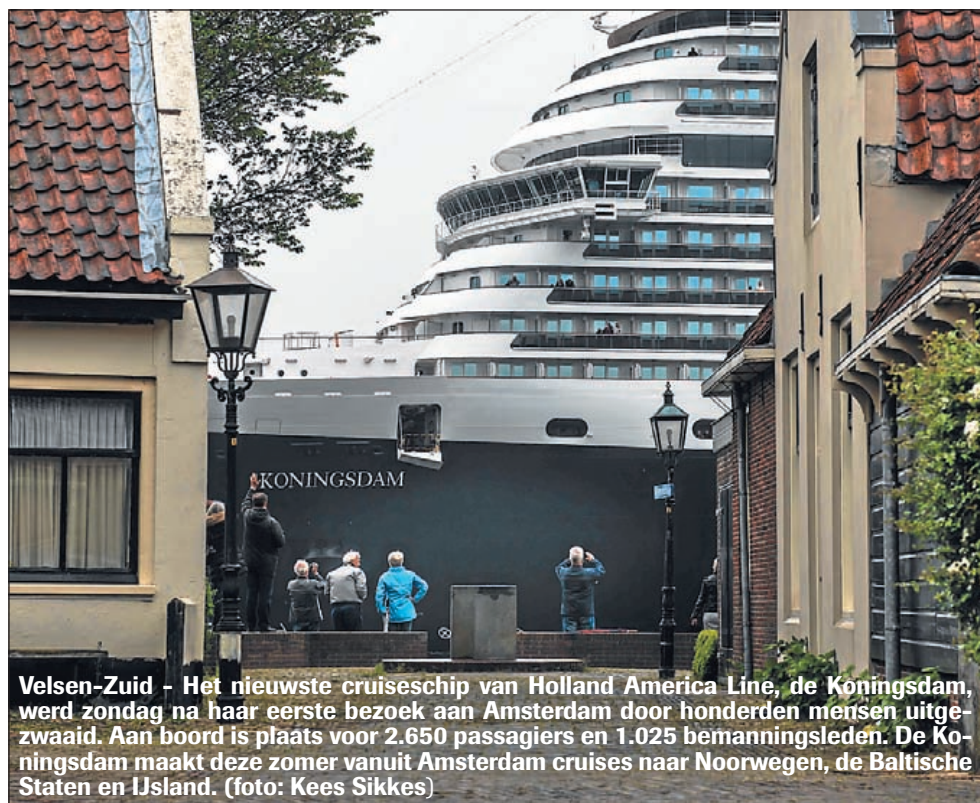
Velsen-Zuid - Het nieuwste cruiseschip van Holland America Line, de Koningsdam, werd zondag na haar eerste bezoek aan Amsterdam door honderden mensen uitgezwaaid. Aan boord is plaats voor 2.650 passagiers en 1.025 bemanningsleden. De Koningsdam maakt deze zomer vanuit Amsterdam cruises naar Noorwegen, de Baltische Staten en IJsland.

Zorgbalans gaat de woningen huren van Velison Wonen. De verwachting is dat de eerste bewoners over ongeveer een jaar hun intrek kunnen nemen in het gebouw.