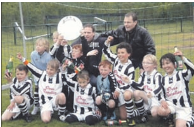
Onze Gezellen F2 - Onze Gezellen F2 begon in augustus 2009 als 10 individuen, maar groeide in de loop van het seizoen uit tot een hechte groep. Een leuk team, dat leerde voor elkaar te werken en dat samen op 1 mei een prachtig kampioensfeest kon vieren, nadat de uitwedstrijd tegen Bloemendaal F5 in een fantastische 10-1 zege eindigde.