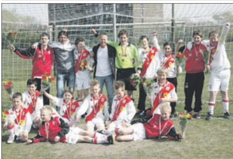
SVIJ D2 - SVIJ D2 is kampioen in de derde klasse geworden. Dit team heeft alle wedstrijden gewonnen en kan zich dus terecht winnaar noemen. Geen tegenstander kon winnen van dit talentvolle team, een hele prestatie.