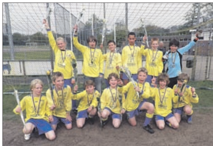
Velsen D4 - Na een bloedstollende wedstrijd van Velsen D4 tegen Uitgeest D6, waar ternauwernood een gelijkspel kon worden weggesleept, konden zaterdag dan toch na het laatste fluitsignaal de feestelijkheden beginnen. Zonder één wedstrijd te verliezen werd het kampioenschap van de voorjaarcompetitie definitief binnengehaald door Velsen D4.