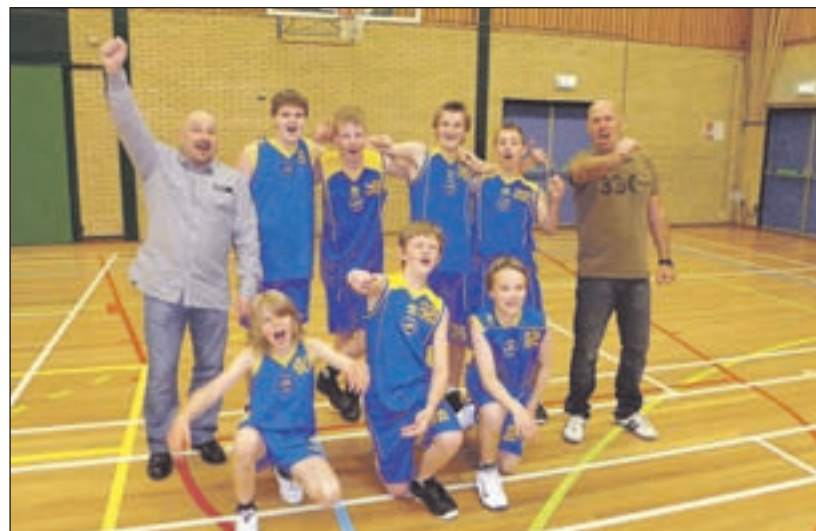
Akrides jongens onder 14-4 - Dit seizoen is van Basketball Vereniging Akrides het vierde jongensteam onder 14 jaar kampioen geworden. Het seizoen was een belevenis van makkelijke overwinningen maar ook van moeilijke wedstrijden die soms werden verloren. De jongens bleken echter stuk voor stuk knokkers en hebben uiteindelijk de hoofdprijs binnen weten te halen.