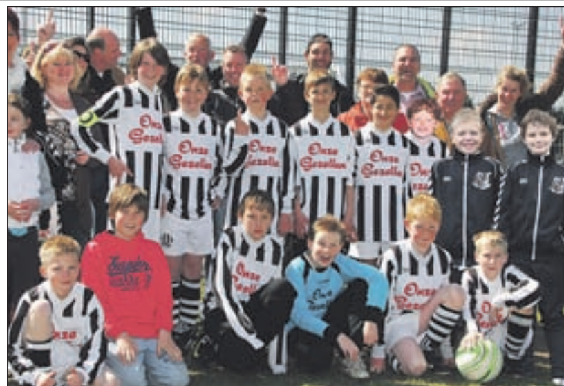
Onze Gezellen D6 - Alle aandacht van team D6 ging uit naar de laatste wedstrijd: Onze Gezellen bovenin de poule tegen een ander team onderaan in de poule. Helaas kwam de tegenstander niet opdagen. Wel een domper omdat spelen belangrijker is dan winnen, maar soms verliest een ploeg en is een ander winnaar. D6 kon een feestje gaan vieren.