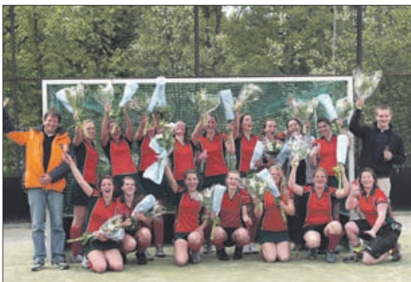
Strawberries Dames 3 - Het gebeurt niet vaak dat een seniorenteam van Strawberries kampioen wordt. Vorige week viel de eer te beurt aan Heren 1, afgelopen zondag kon de champagne ontkurkt worden voor Dames 3, een team vol gezellige meiden die sinds twee jaar samen in de senioren spelen.