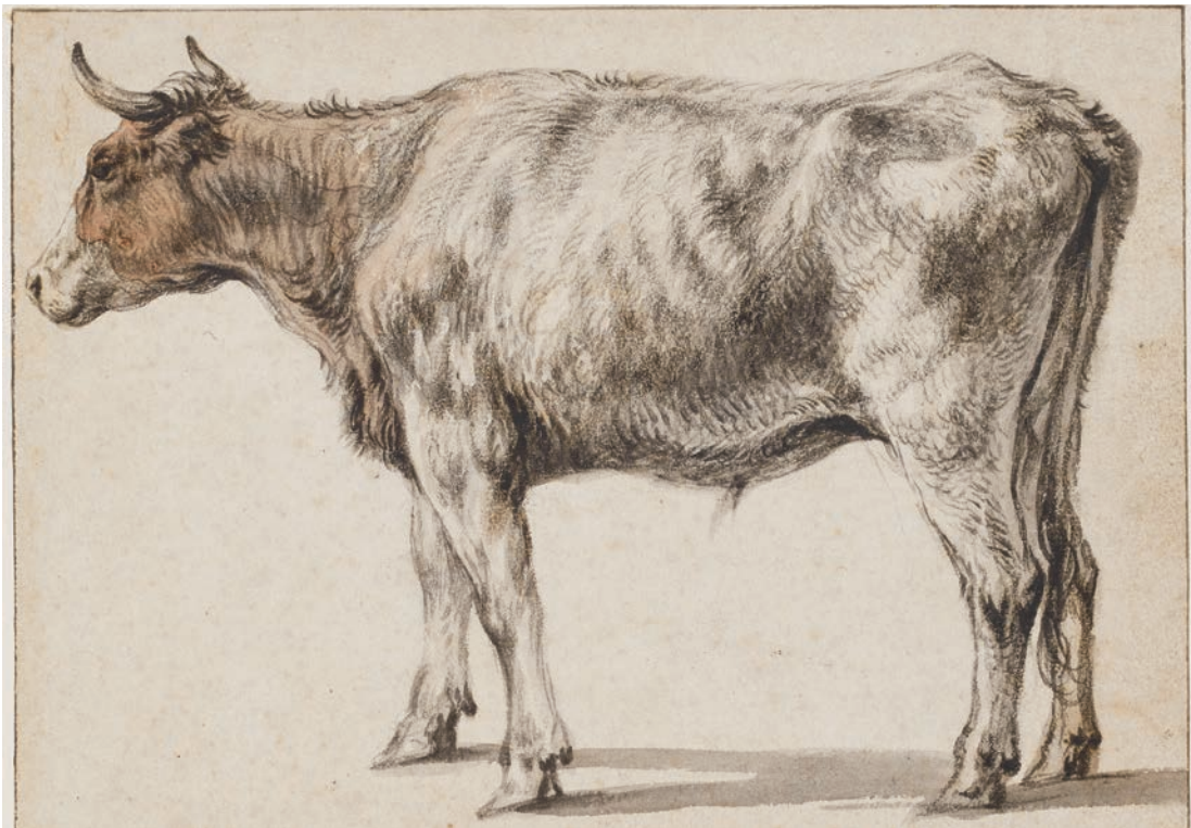
Een staande jonge stier ca. 1650 Aelbert Cuyp