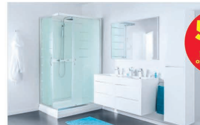
Meubel Linie Oceade - glanzend wit - richtprijs 120 cm: €1067,00 €533,50 Kolomkast Linie Oceade - glanzend wit - 35 cm: €419,00 €251,40