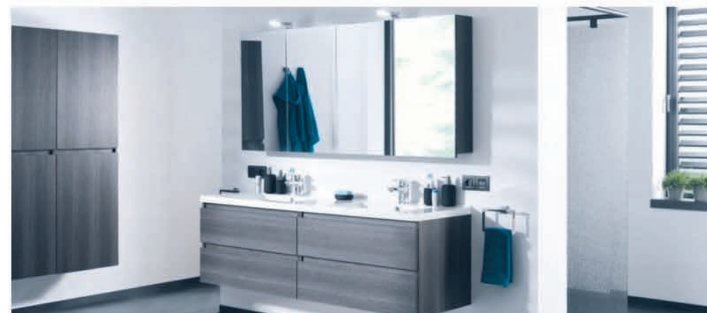
Meubel Storke Loft grove zwarte eik - wastafel in composietmarmor - richtprijs 130 cm: €2395,00 €1197,50 Kolomkast Storke Loft grove zwarte eik - 35 cm: €489,00 €293,40