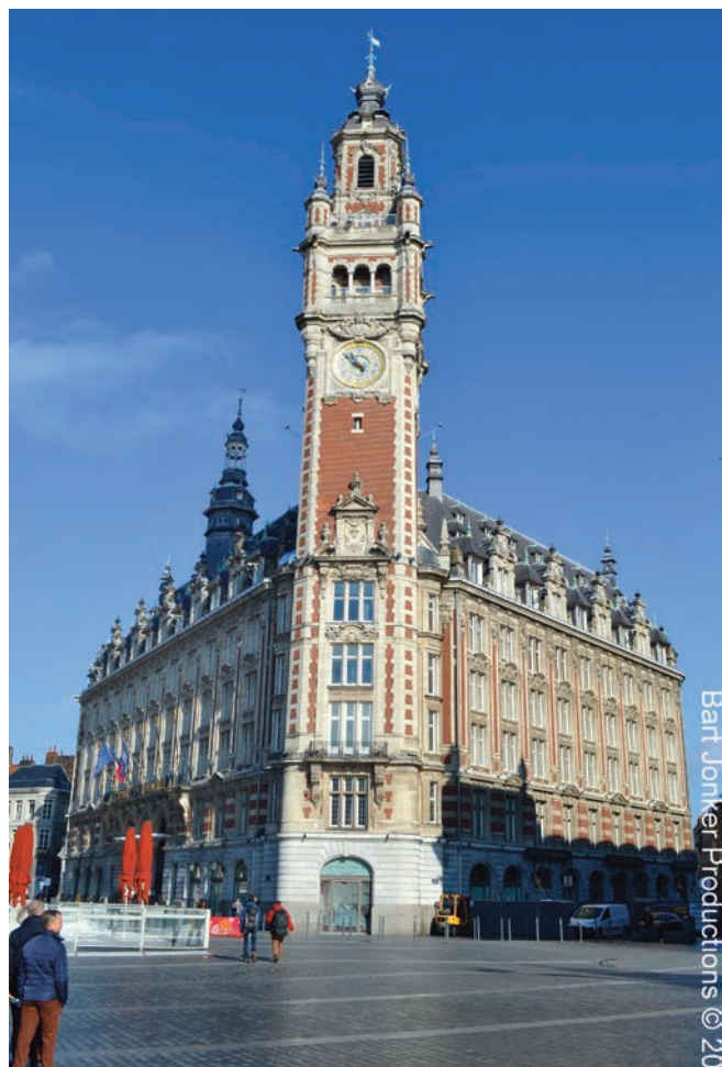
Bart Jonker Productions © 2018