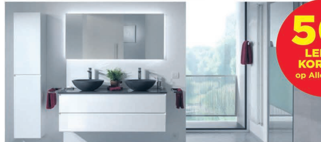
Meubel Balmani Mitra glanzend wit - wastafel in graniet - richtprijs 135 cm: €3467,00 €1733,50 Kolomkast Balmani Mitra glanzend wit - 35 cm: €1149,00 €689,40