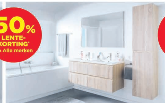
Meubel Linie Express - kleur natuur eik - richtprijs 120 cm: €927,00 €463,50 Kolomkast Linie Express - kleur natuur eik - 35 cm: €399,00 €239,40