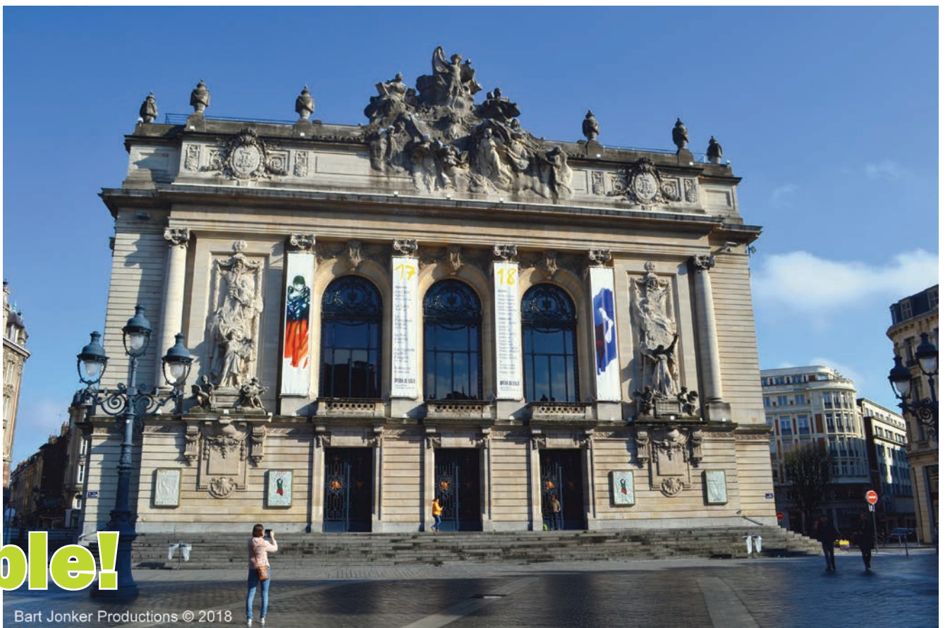
Bart Jonker Productions © 2018