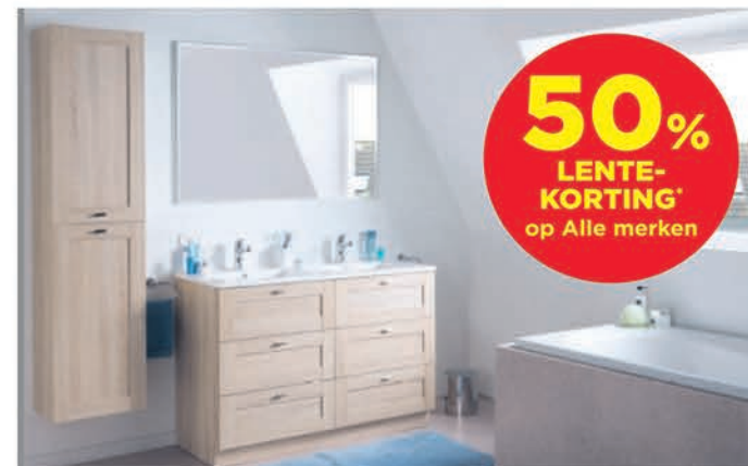
Meubel Linie Festine - kleur natuur eik - richtprijs 120 cm: €1287,00 €643,50 Kolomkast Linie Festine - kleur natuur eik - 35 cm: €419,00 €251,40