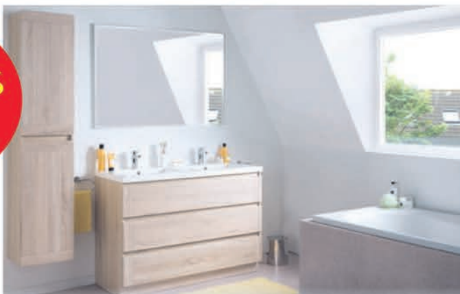
Meubel Linie Matisse - kleur natuur eik - richtprijs 120 cm: €1207,00 €603,50 Kolomkast Linie Matisse - kleur natuur eik - 35 cm: €419,00 €251,40