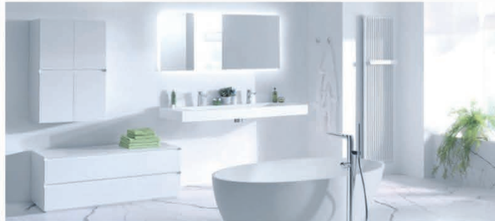
Meubel Balmani Mitra Elements mat wit - wastafel in solid surface - richtprijs totale breedte 300 cm: €8266,00 €2827,90 Vrijstaand bad Balmani Fahro - solid surface - 160 x 85 cm: €2399,00 €1199,90