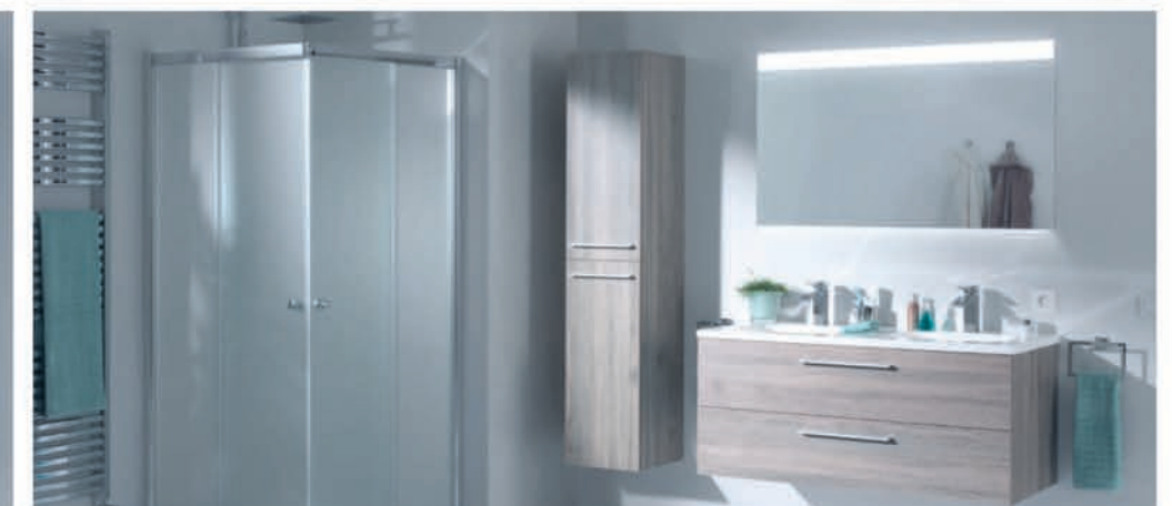
Meubel Storke Noa grove eik - wastafel in composietmarmor - richtprijs 120 cm: €1827,00 €913,90 Kolomkast Storke Noa grove eik - 35 cm: €409,00 €245,40