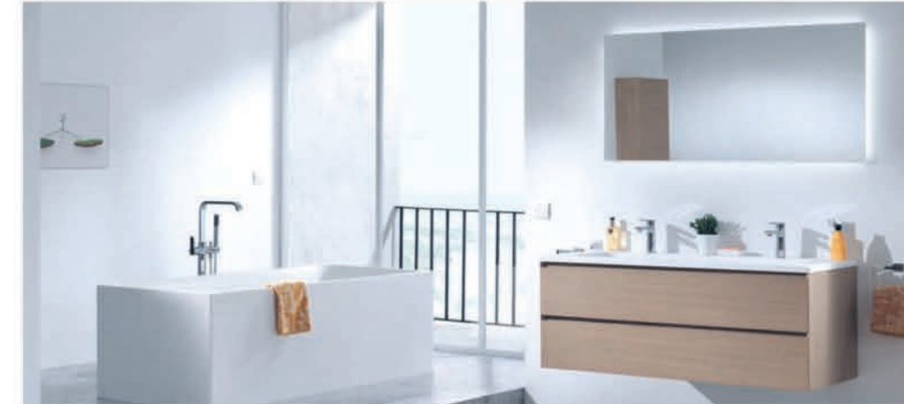
Meubel Balmani Mitra verweerde eik - wastafel in composietmarmor - richtprijs 135 cm: €3517,00 €1758,50 Vrijstaand bad Balmani Fabula - solid surface - 180 x 80 cm: €3199,00 €1599,90