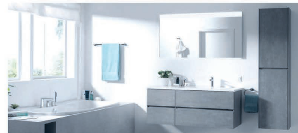
Meubel Storke Edge beton grijs asymmetrisch - wastafel in composietmarmor - richtprijs 130 cm: €2526,00 €1233,90 Kolomkast Storke Edge beton grijs - 40 cm: €589,00 €353,40