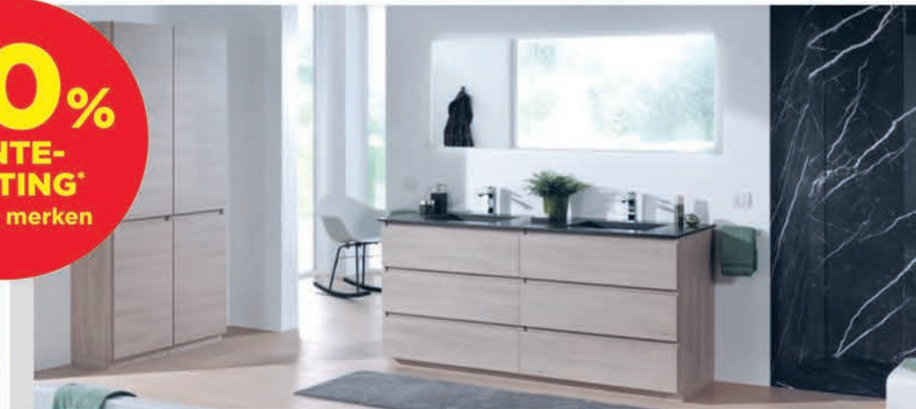
Meubel Balmani Lucida verweerde eik - wastafel in graniet - richtprijs 135 cm: €4385,90 €2192,95 Kolomkast Balmani Lucida verweerde eik - 45 cm: €826,90 €497,24