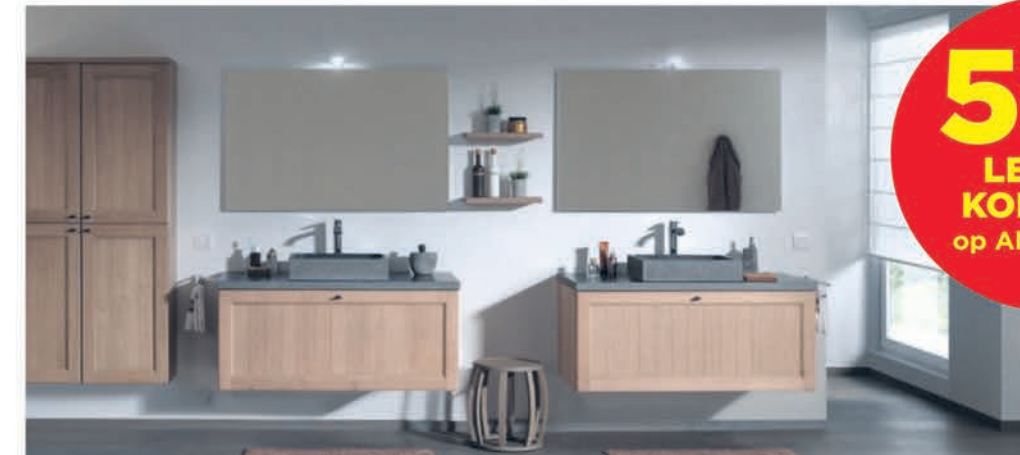
Meubel Balmani Lemon verweerde eik - wastafel in graniet - richtprijs 120 cm: €2487,00 €1233,50 Kolomkast Balmani Lemon verweerde eik - 45 cm: €1216,90 €731,24