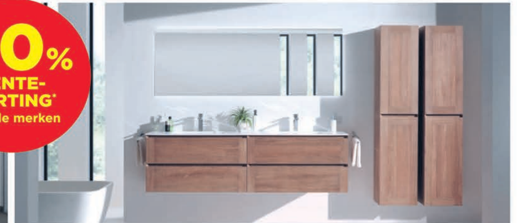
Meubel Balmani Mitra teak - wastafel in solid surface - richtprijs 135 cm: €4816,00 €2408,90 Kolomkast Balmani Mitra teak - 45 cm: €1549,00 €929,40