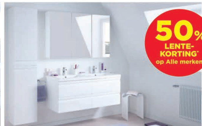
Meubel Linie Trend - glanzend wit - richtprijs 120 cm: €1047,00 €523,50 Kolomkast Linie Trend - glanzend wit - 35 cm: €399,00 €239,40