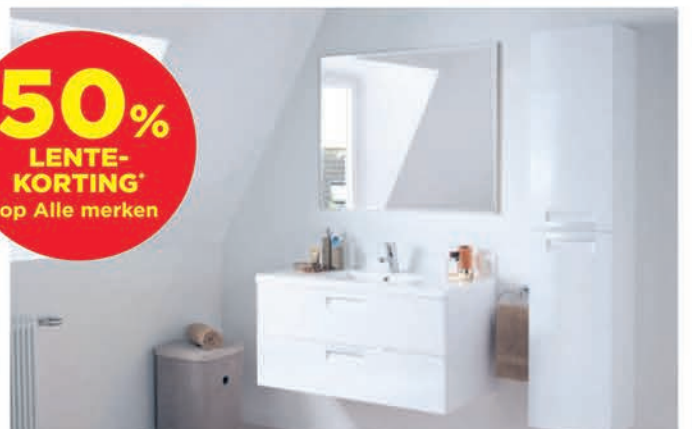
Meubel Linie Sensa - glanzend wit - richtprijs 60 cm: €487,00 €243,50 Kolomkast Linie Sensa - glanzend wit - 35 cm: €339,00 €203,40