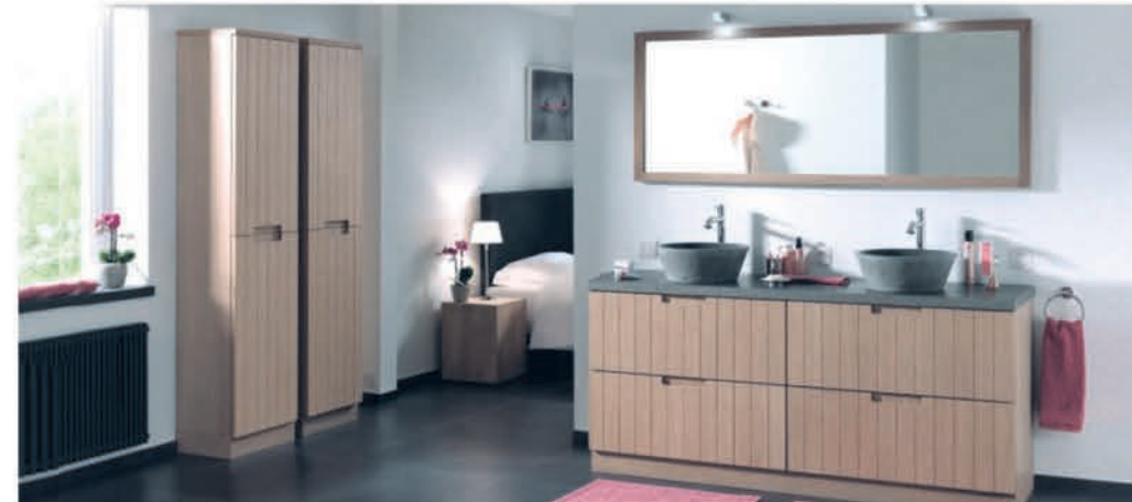
Meubel Balmani Adagio verweerde eik - wastafel in graniet - richtprijs 135 cm: €3825,90 €1912,95 Kolomkast Balmani Adagio verweerde eik - 45 cm: €1276,90 €767,28