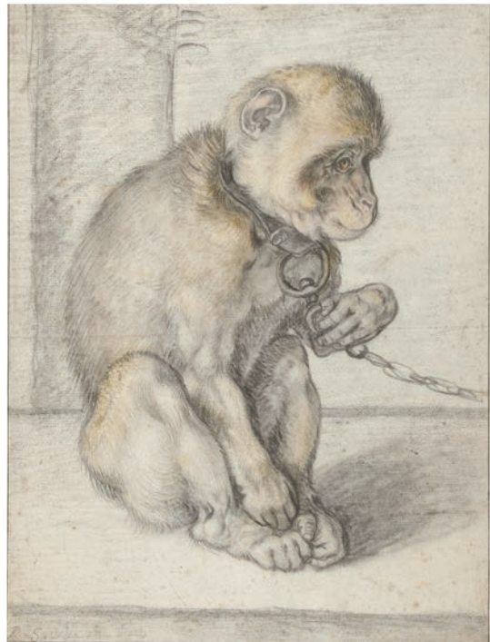
Een zittende aap aan een ketting, 1592-1602 Hendrick Goltzius collectie Rijksmuseum

vrijdagmiddagen, lezingen over tekeningen én over dieren en afternoon tea's waarin een boeiende rondleiding wordt gecombineerd met een zoete en hartige afsluiting van het bezoek. Cromhouthuis, Herengracht 366 – 368 te Amsterdam www.cromhouthuis.nl