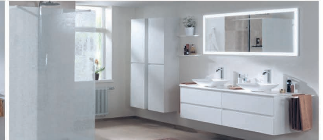
Meubel Balmani Mitra mat wit - wastafel in solid surface - richtprijs 135 cm: €3646,00 €1823,90 Kolomkast Balmani Mitra mat wit - 35 cm: €1149,00 €689,40