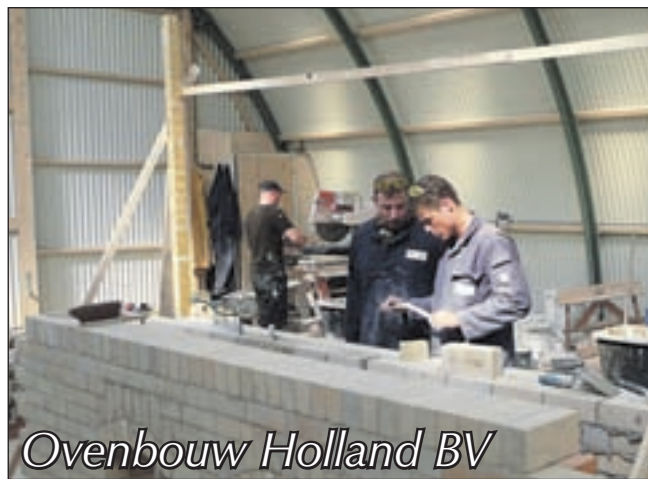
Ovenbouw Holland BV

IJmuiden - De politie heeft zondag om 00.30 uur op de Havenkade een 23-jarige man uit IJmuiden op zijn snorfiets aangehouden omdat hij door rood licht en tegen het verkeer in reed. De man bleek bij controle zoveel te hebben gedronken dat hij direct verzocht werd zijn rijbewijs in te leveren. Rijden onder invloed is een misdrijf. Meer dan 0,5 promille is strafbaar. Bij 1,3 promille wordt het rijbewijs ingenomen.