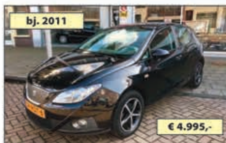
bj. 2011 SEAT IBIZA 1.2 TDi STIJLE ECO € 4.995,-