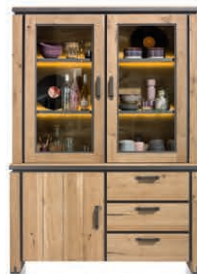
8 Buffetkast 'Farmland' Traditioneel in een modern jasje. Met ledverlichting en soft-closing systeem. 210 x 150 x 45 cm. Nu 1.799,-