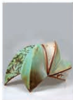
Jannie van der Wel keramiek

Tijdens de KUNSTLIJN op zaterdag 2 en zondag 3 november van 11:00 tot 17:00 uur bent u van harte welkom in ons Kunst- en Inspiratiecentrum. Met een hapje en een drankje kunt u genieten van onze bijzondere exposities. De kunst van het koffie en thee drinken wordt u aangeboden door Bobplaza.