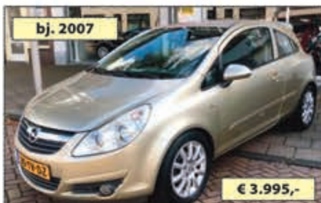
bj. 2007 OPEL CORSA 1.0 12V ESSENTIA € 3.995,-