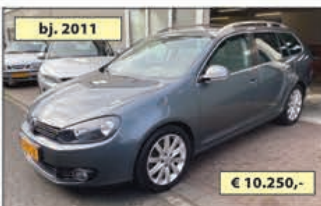
bj. 2011 VW GOLF 1.4 TSi AUTOMAAT € 10.250,-