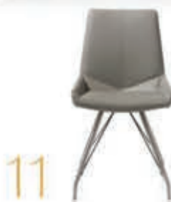
11 Stoel 'Levi' In diverse kleuren. Ook mogelijk op sledevoet. Vanaf 249,-