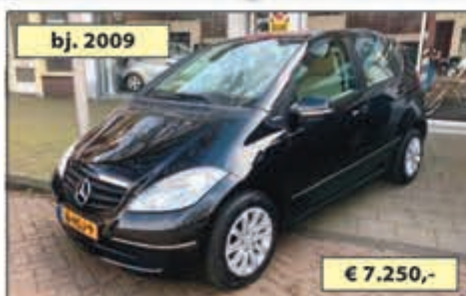
bj. 2009 MERCEDES A 150 BLUE FF CLASSIC € 7.250,-

AL 40 jaar een begrip in de IJmond en omstreken