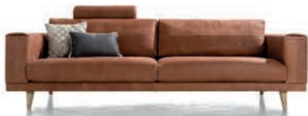
1 Bank 'Praia' Stoere, markante bank! Past door z'n eenvoud in ieder interieur. 3 zits in leder vanaf 1.299,- In stof Vanaf 999,-