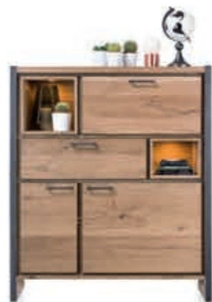
6 Highboard 'Metallo' Een robuuste kast met een stoer design en geïntegreerde ledverlichting. Nu 1.349,-