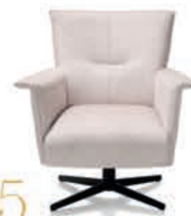
15 Draifauteuil 'Carola' Leverbaar met lage en hoge rug. Keuze uit stof en leer. In stof Vanaf 649,-