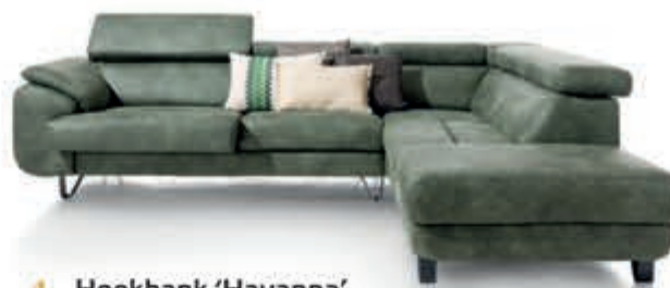
4 Hoekbank 'Havanna' Een populaire hoekbank met verstelbare zittingen en hoofdsteun. In stof Leopard Nu 1.999,-