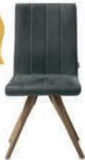
5 Eetstoel 'Elza' Moderne eetstoel in stof. Verkrijgbaar in 4 kleuren. Nu 129,-