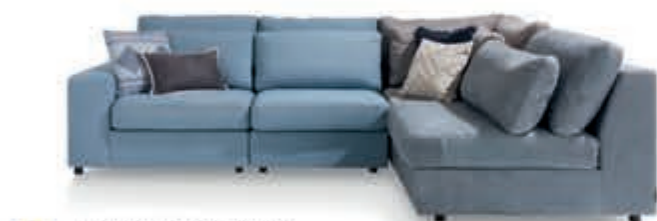
9 Hoekbank 'Braga' Een moderne hoekbank met losse rug- en voorzetkussens. Verkrijgbaar in stof en leer en in 2 verschillende zithoogtes. Vanaf 2.396,-