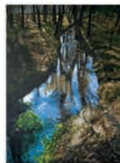
An Luthart ambachtelijk kunstenaar