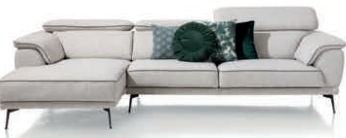
10 Bank 'Santiago' Een comfortabele bank die je eenvoudig opbouwt uit losse elementen. Keuze uit diverse opties. In stof Vanaf 2.198,-