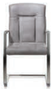
2 Eetstoel 'Jacky' Een stoel die werkelijk in ieder interieur past. In stof Kibo Nu 259,-