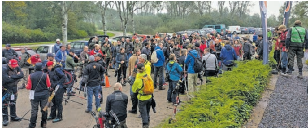
Schutters staan klaar voor de briefing