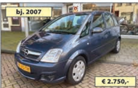
bj. 2007 OPEL MERIVA 1.6 € 2.750,-