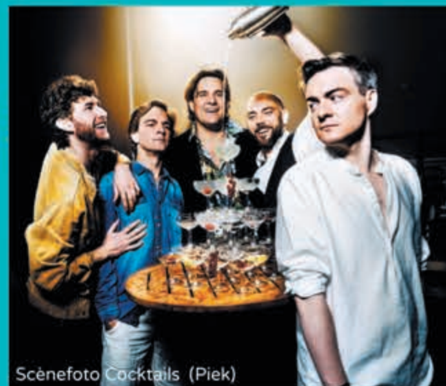
Scènefoto Cocktails (Piek)