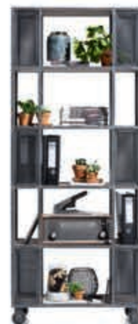
3 Kast 'Vitoria' Een moderne roomdivider met een strak eigentijds design en handige wieltjes. Nu 799,-