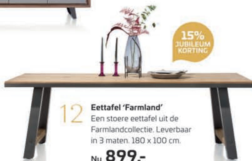
12 Eettafel 'Farmland' Een stoere eettafel uit de Farmlandcollectie. Leverbaar in 3 maten. 180 x 100 cm. Nu 899,-