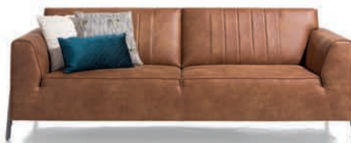
14 Bank 'Zembla' Hippe 2-zitsbank met een eigentijds design en vleugje retro. Ruime keuze in stof en leer en in diverse opstellingen. In microstof Secilia als afgebeeld Nu 899,-