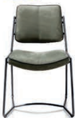
13 Eetstoel 'Tygo' Stoere eetkamerstoel die direct opvalt door het fraaie design. Nu 179,-