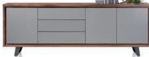
7 DRESSOIR 'Box' Uitgevoerd in tramwood walnoot met licht grijze deuren en laden. 240 cm breed Nu 1.199,-