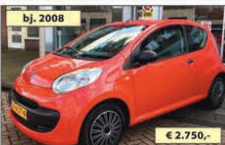
bj. 2008 CITROEN C1 1.0 12V SÉDUCTION € 2.750,-