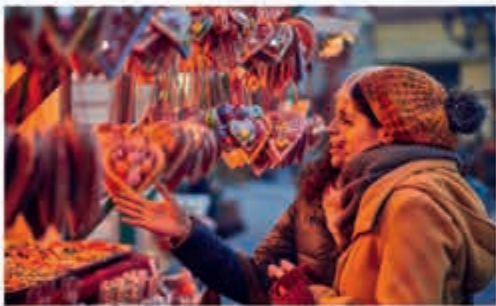
IN- & OUTDOOR KERSTMARKT