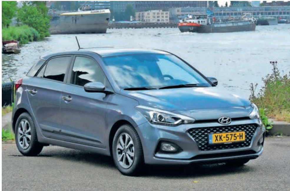
■ Rijden met Hyundai i20 1.0 T-GDI Premium.

Omdat in het interieur geen grote wijzigingen zijn doorgevoerd, beginnen de jaren te tellen. Er is op zich niets mis met het geïntegreerde