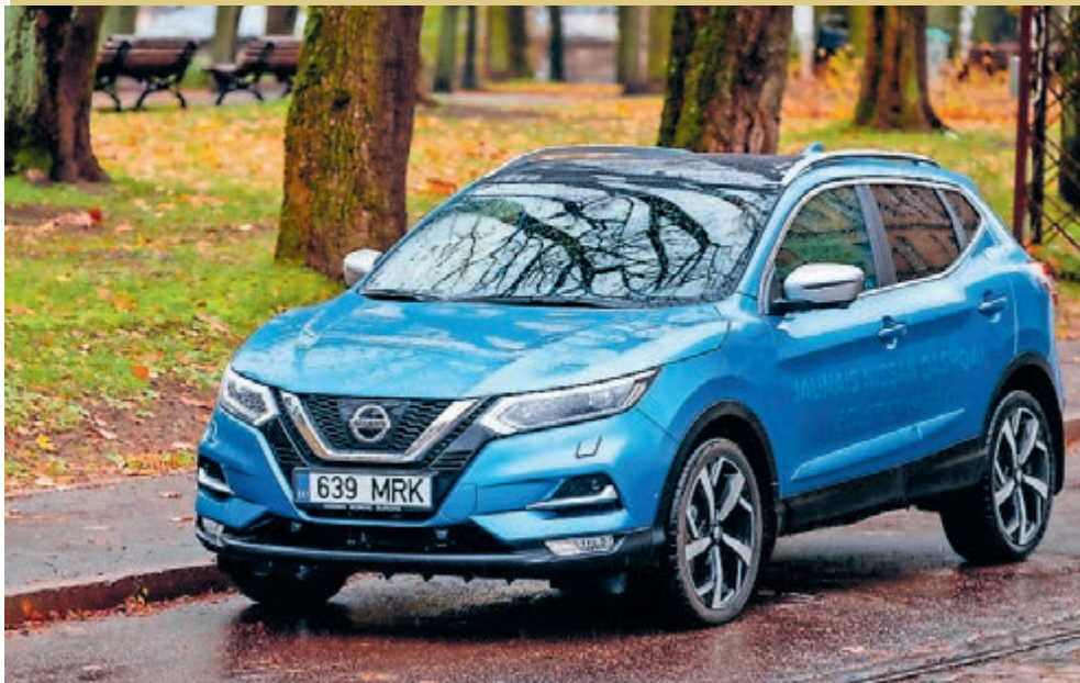
■ Rij vandaag nog in een Nissan Qashqai met heel veel korting.

Wilt u 'echt' van voordeel genieten? Stap nu dan binnen in de showroom van Nissan dealer Rustman gevestigd op de Eysinklaan ofwel de Haarlemse Autoboulevard.