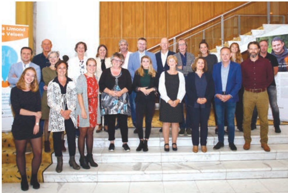
De aanwezige ondernemers/werkgevers voelen zich betrokken bij taal op de werkvloer.