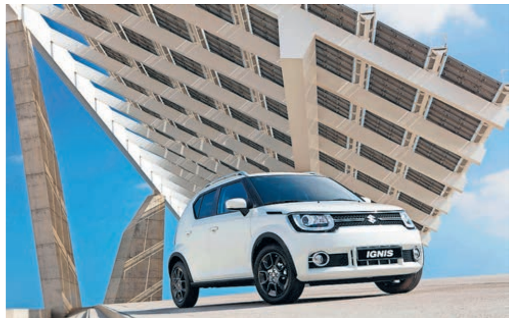
■ Alle handgeschakelde versies van de Suzuki Ignis hebben nu standaard het Smart Hybrid systeem.

DE SUZUKI IGNIS WORDT PER DIRECT NÓG COMPLETER, WANT ELKE HANDGESCHAKELDE VERSIE IS VANAF HEDEN STANDAARD UITGERUST MET HET SUZUKI SMART HYBRID-SYSTEEM. De prijs is ongewijzigd. De Ignis is te koop vanaf 15.899 euro.