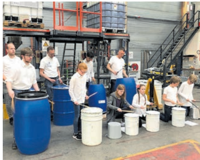
Drummers van Soli bij RIGO Verffabriek

Het Inloophuis is voor iedereen die tijdelijke ondersteuning zoekt om te leven met en na kanker. Ook naasten zijn welkom, evenals mantelzorgers en nabestaanden. Wij bieden een luisterend oor, deskundige begeleiding en vele activiteiten.