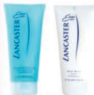
Eau de Lancaster douche en/of bodylotion