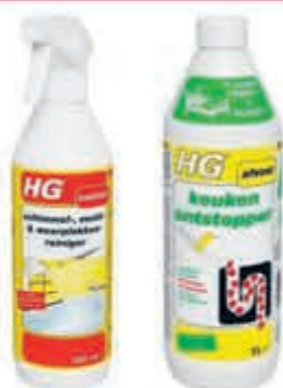
HG Compleet assortiment