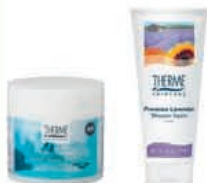
Therme Compleet assortiment