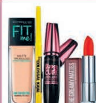
Maybelline make up Compleet assortiment