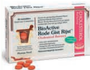
Bio Active Rode Gist 90