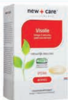
New Care Visolie 60 capsules

Alkmaar • Bergen • Beverwijk • Castricum • Heemskerk • Santpoort-Noord • Uitgeest • Wormerveer