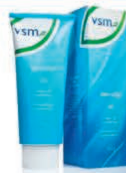
VSM Spiroflor 150gram