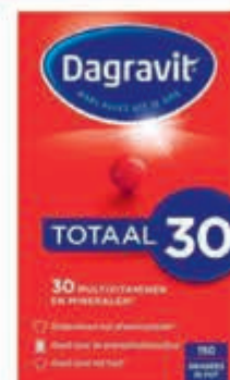
Dagravit vitamine Compleet assortiment