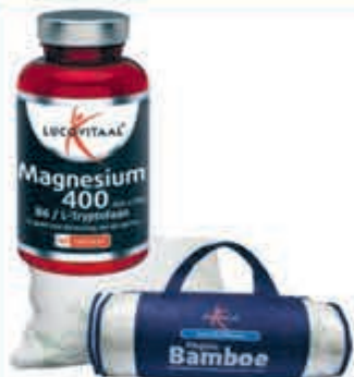
Lucovitaal Compleet assortiment