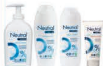
Neutral Compleet assortiment