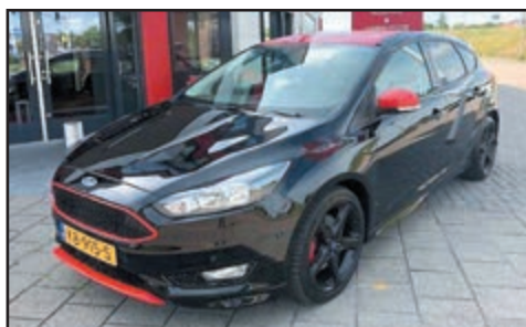
Ford Focus 1.5 Black Edition Bj. 2016