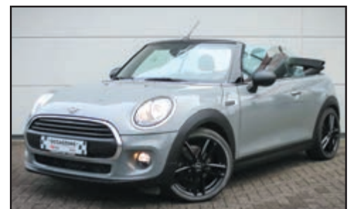
Mini Cooper 1.5 One Salt Business Bj. 2018