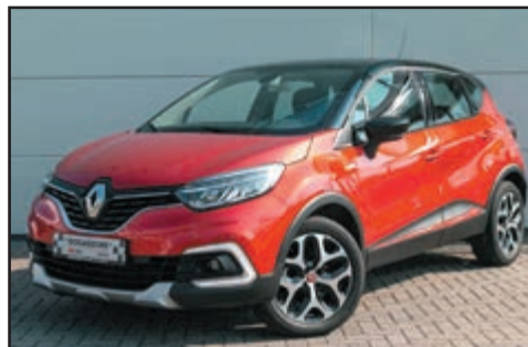
Renault Captur Easy Life Pack 1.2 Tce Intens Bj. 2018