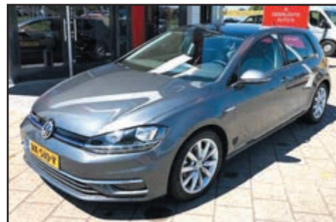
Volkswagen Golf 1.5 TSi Comfortline Business Bj. 2018