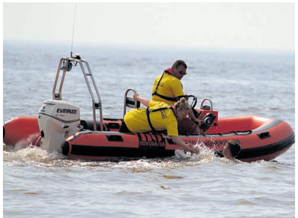
Lifeguards halen een zwemmer uit het water

Mocht men iemand willen verassen met dit leuke boekje, dan is het te bestellen via boekenbestellen.nl en alle webwinkels. Natuurlijk kan men ook even langskomen voor informatie in buurtcentrum de Spil.