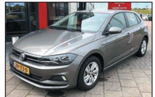
Volkswagen Polo 1.0 TSi Comfortline Bj. 2018