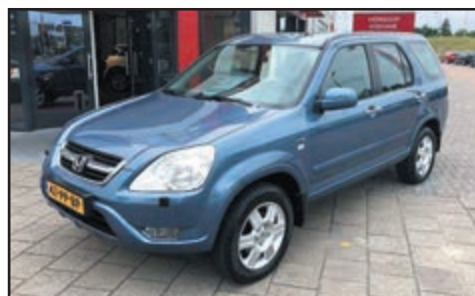
Honda CR-V 2.0i Executive automaat Bj. 2004