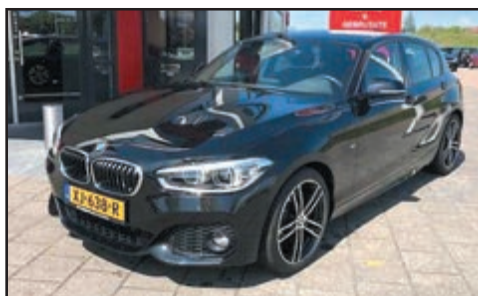
BMW 1 Serie 118i Edition M Sport Shadow Executive Bj. 2018