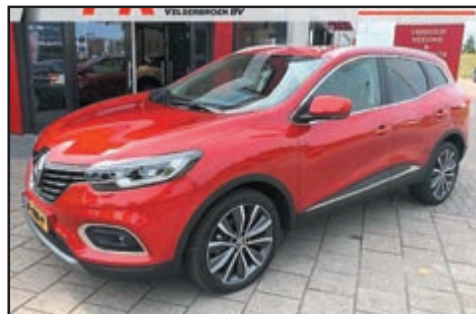
Renault Kadjar 1.3 Tce Intens automaat Bj. 2019