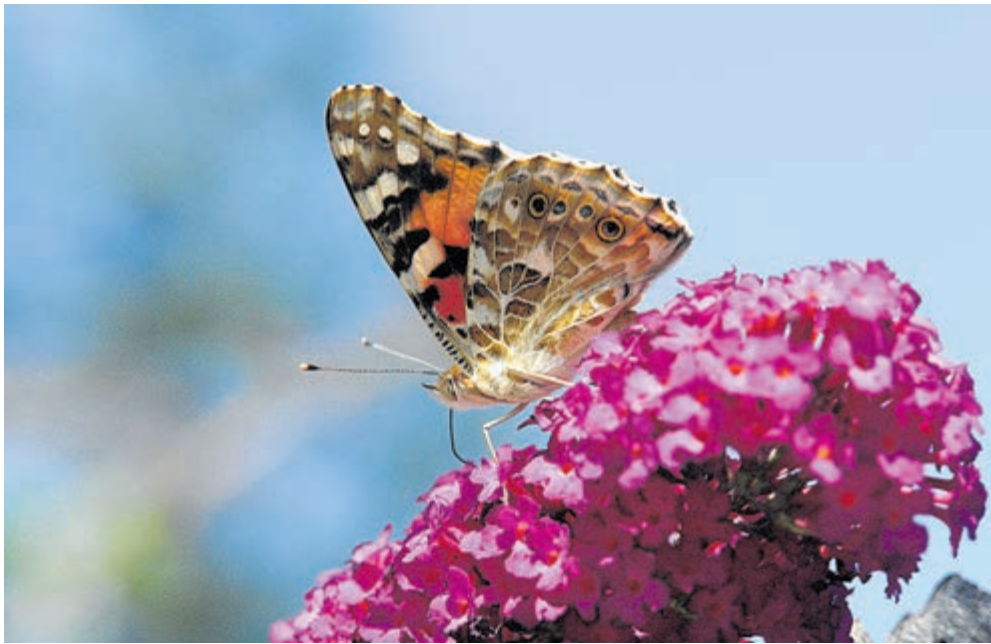
Zou de distelvlinder dit jaar winnen?