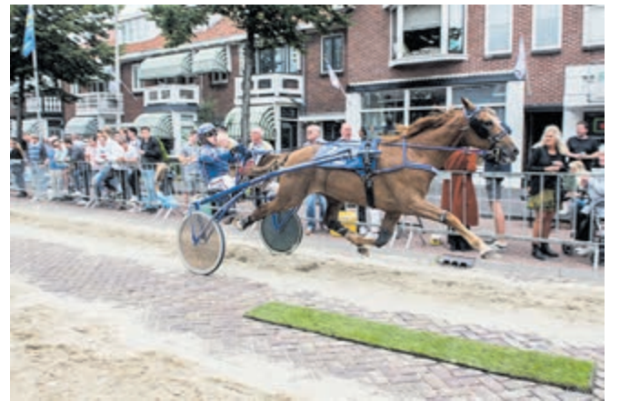
Het publiek genoot van de spectaculaire races, vorige week woensdag op de Kennemerlaan

Over twee weken, op donderdag 1 augustus, staat de 2e ronde voor de Pikeursprijs van de IJmond op het programma, op de Hoofdstraat in Santpoort. Ronde 3 wordt een week later verreden op 8 augustus, op de Breesstraat in Beverwijk. Donderdag 5 september volgt de apotheose op de Marquettelaan in Heemskerk.