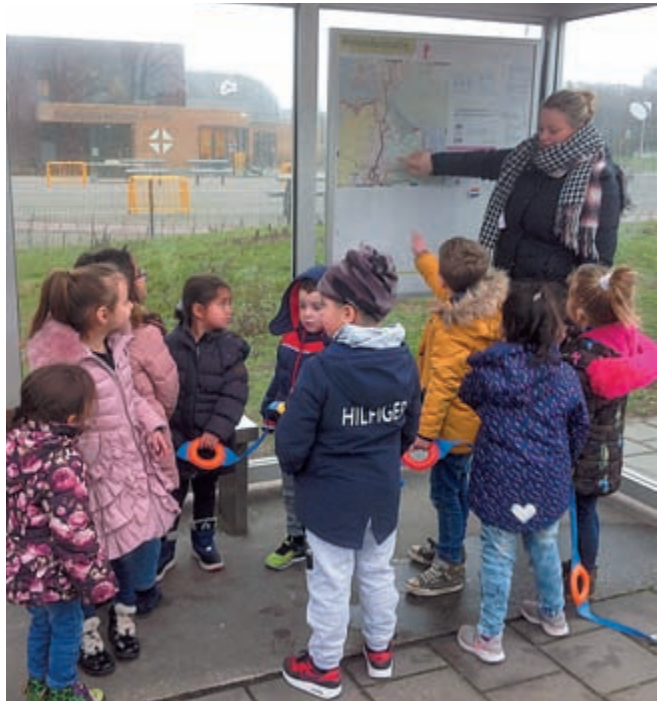
Een aantal leerlingen uit de kleutergroepen leert hoe 'een ritje met de bus maken' gaat, dit in het kader van het thema 'op wienel' (foto: aangeleverd)

blik in het verleden te bieden. Jolande de Lalaing is te bezoeken in haar torenkamer op het Kasteel en Aagje de Vertelster vertelt het verhaal over 'De Ridder en de Held'. Op zaterdag wordt om 12.00 uur het toernooi officieel geopend met het eerste Riddersteekspel. De geschiedenis van de Ruïne wat ooit het machtige Kasteel van Brederode was komt als nooit tevoren tot leven. Voor meer informatie en het programma kijk op de website ruinevanbrederode.nl . Entreeprijs ruïne inclusief toernooiveld: volwassenen € 7,50, kinderen 4 t/m 11 jaar € 5,-, kinderen t/m 3 jaar gratis. Beide dagen is de ruïne geopend van 11.00 - 17.00 uur. (foto: aangeleverd)