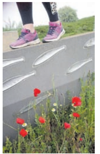
De winnende foto van Henny de Wit

deren bij een stempelpost. „Ze gaan al vanaf de eerste Vissenloop mee; toen nog in de draagzak door de regen“, vermeldt Kwant. Schilling vult aan: „Deze foto geeft het familiegevoel weer. Dat past ook goed bij de Vissenloop.“ Kwant deelt de derde prijs met de foto van Diana van Loon. „Hoewel de Vissenloop niet direct herkenbaar is, is de combinatie in het beeld van zand, Zuidpier en wandelaars toch bijzonder“, verdedigt Schilling de keuze van de jury.