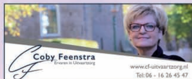
CF Coby Feenstra Ervaren in Uitvaartzorg

www.cf-uitvaartzorg.nl Tel: 06 - 16 26 45 47