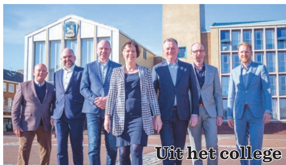
Uit het college