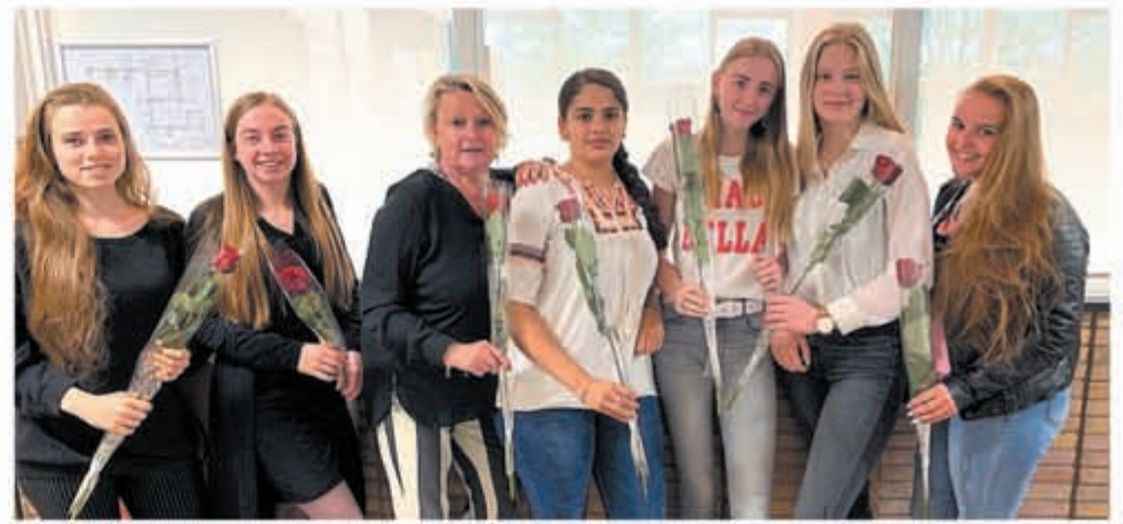
Geslaagden en hun trotse mentoren op het Tender College