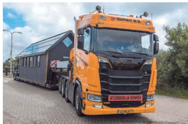
Dinsdag arriveerden de eerste tiny houses op het strand

Waterveiligheid staat daarbij hoog op de agenda, omdat de nieuwe plaats buitendijks gebouwd zal worden - een interessante keuze in een tijd waarin de zeespiegel stijgt.