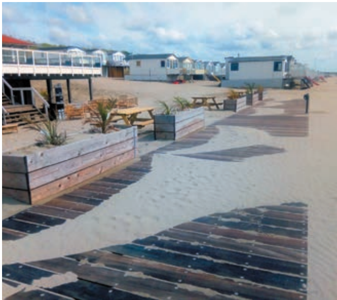
De nieuwe boardwalk zou, doordat er gemakkelijk zand op waait, een niet te nemen hindernis zijn voor mensen met een rollator