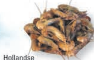
Hollandse ongepelde garnalen