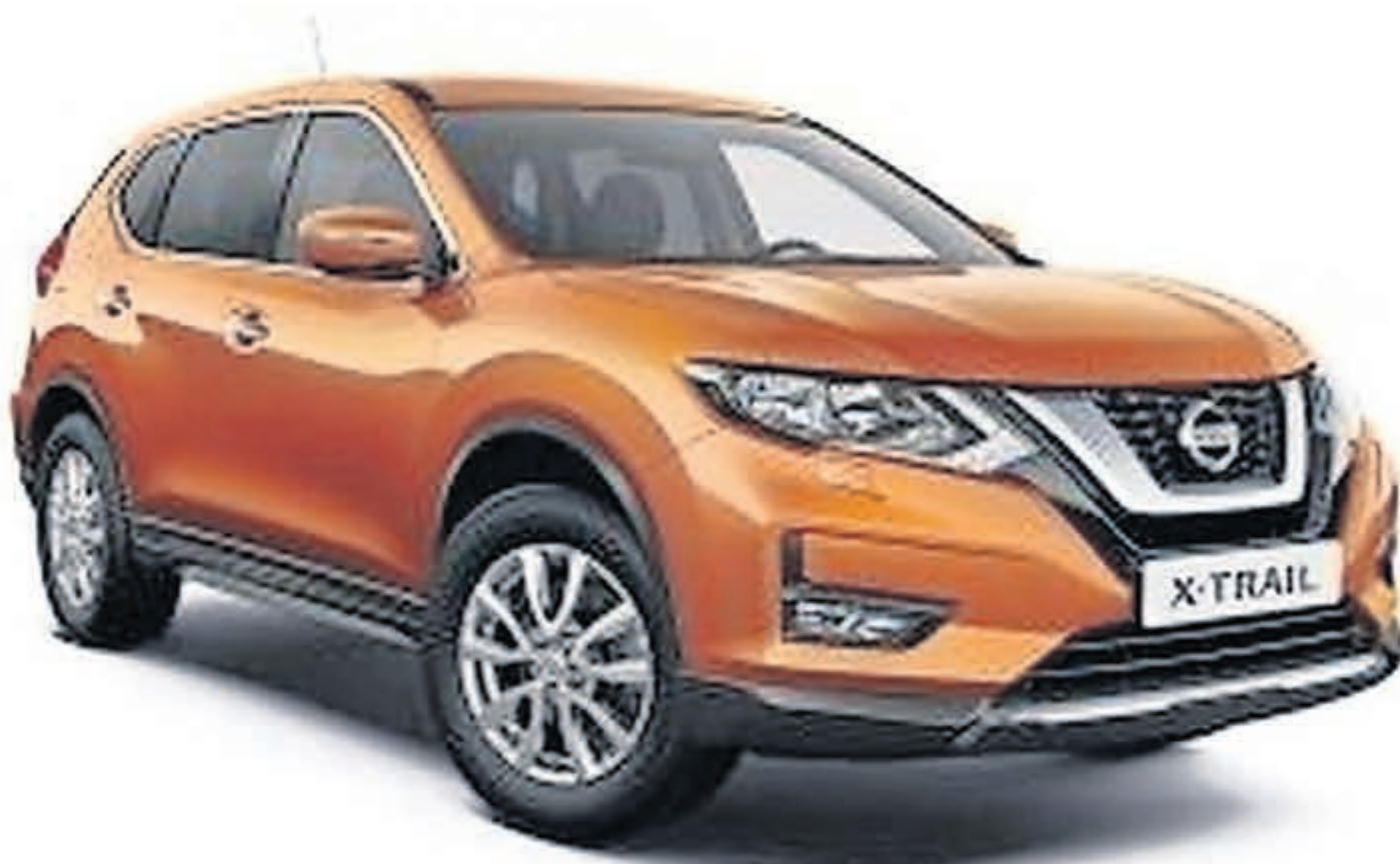
■ De Nissan X Trail (FOTO:)

Wil je graag een SUV met ruimte, rust en rijcomfort? Houd je van een grote auto, maar niet