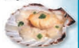
Scallops in schelp