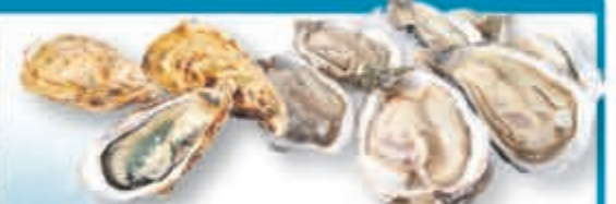
Diverse Oester uit Nederland, Frankrijk en Ierland