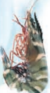
Primstar Wild Tiger