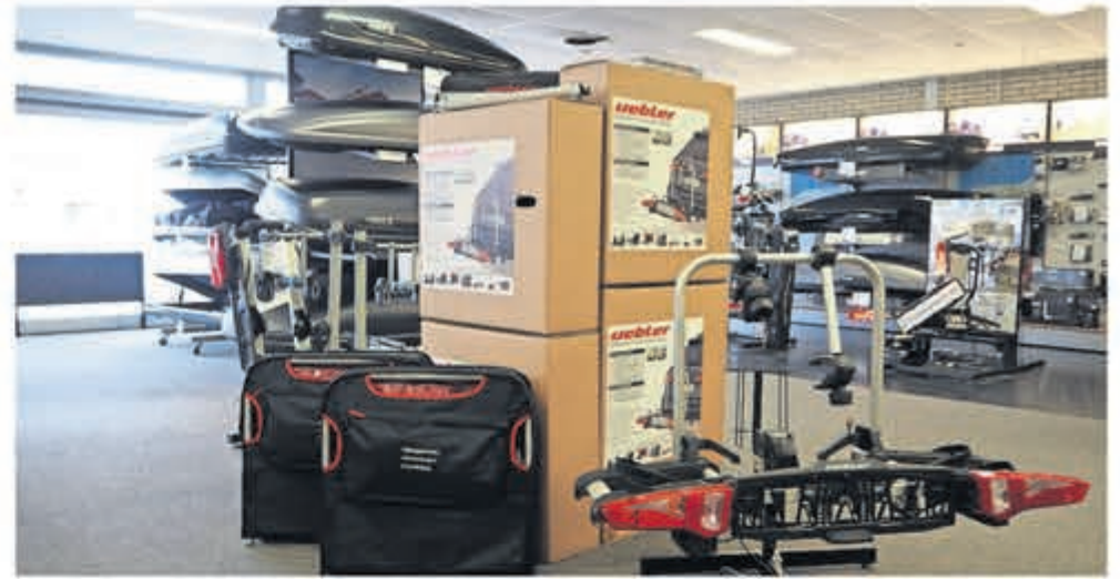
■ Jim Barens OTOTOTAAL

HAARLEM - Al ruim 45 jaar is Jim Barens OTOTOTAAL een begrip in Haarlem en omgeving. Naast een ruime winkel met een groot assortiment aan auto-accessoires, maar ook bijvoorbeeld Bosch ruitenwissers, Motip autolakken, motorolie, accu's, onderhouds- en poetsmiddelen waaronder Meguiars en natuurlijk een showroom met een zeer ruime keuze in fietsendragers, dakkoffers en dakdragers, heeft Jim Barens OTOTOTAAL ook een eigen werkplaats waar ervaren en gecertificeerde monteurs dagelijks bezig zijn met de laatste technieken in de auto-electronica.