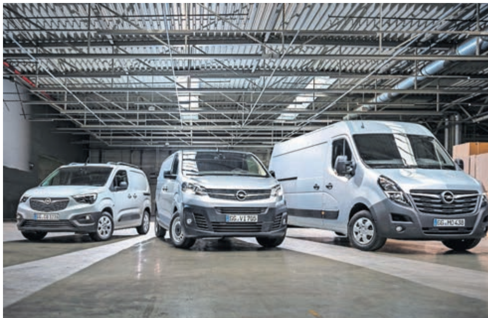
■ De Opel Movano in drie uitvoeringen beschikbaar.

De nieuwe Movano is net als voorheen beschikbaar in vier lengte- en drie hoogtematen. Het maximaal toelaatbare gewicht bedraagt 4,5 ton en het maximale laadvolume 17 m 3 . Meer dan 150 carrosserie- en ombouwvarianten zijn af fabriek leverbaar en afhankelijk van de variant kan de Movano tot wel vijf europalets vervoeren.