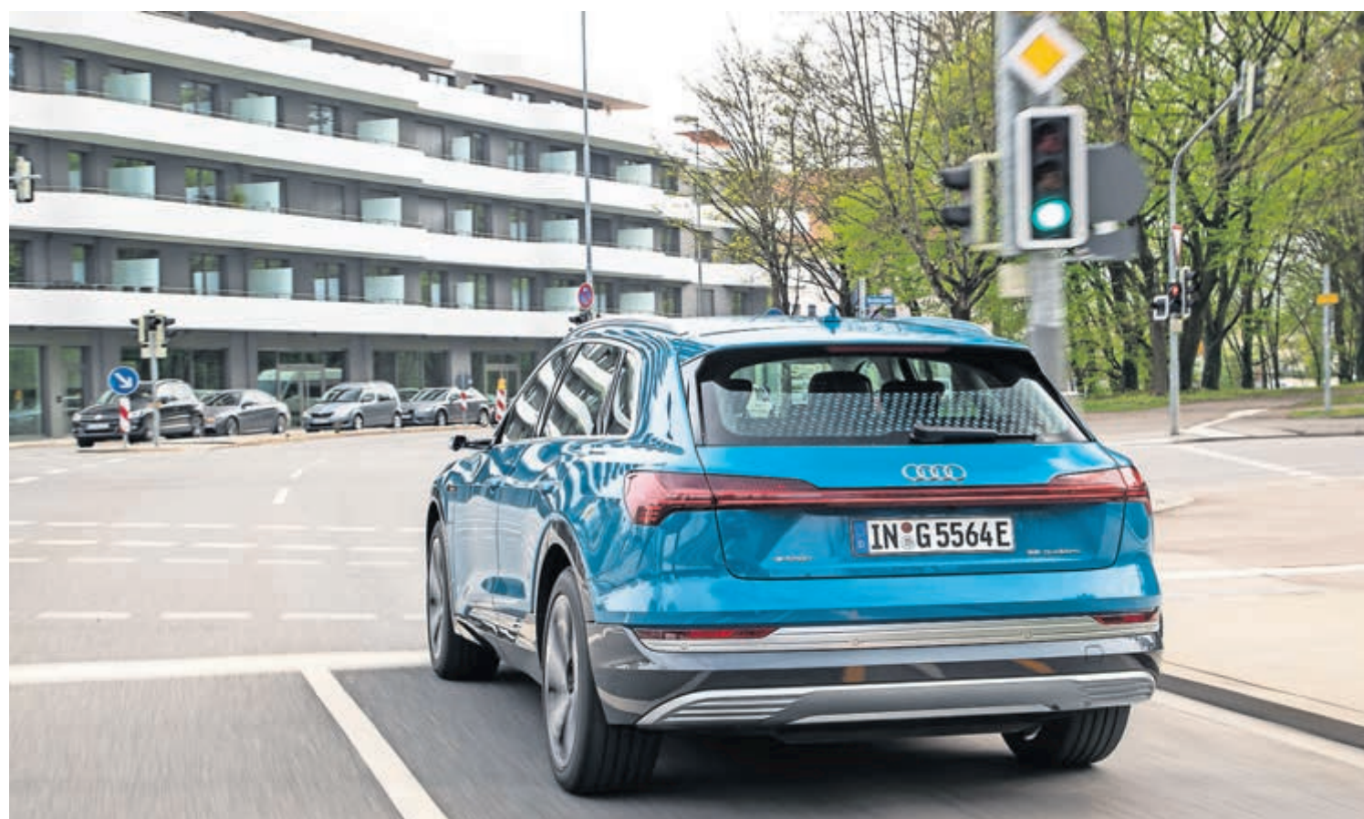
■ Audi is introducing the vehicle-to-infrastructure (V2I) service "Traffic Light Information" to Europe. Starting this summer Audi will network new models with the traffic lights in Ingolstadt/Germany; further European cities will follow from 2020 onwards. Then cars will be more likely to catch a "gre"

"Deze geavanceerde V2I-technologie komt twee jaar later in Europa beschikbaar dan in de VS