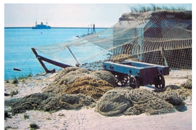
Bunker S-7-80 Stekelvarken, op de achtergrond ss Van Renselaer

In 1881 wordt er begonnen met de bouw van een pantserfort in de duinen op de noordelijke oever van het 5 jaar ervoor geopende Noordzeekanaal bij IJmuiden. Het is pas 1886 als de eerste soldaten vanuit Haarlem van het 4e Regiment Vestingartillerie komen kijken hoe hun fort daar vlak bij de Noordzee eruit komt te zien. Nog twee jaar moeten ze wachten, dan zijn de vijf enorme kanonnen in de pantsergalerij en de twee kleinere vuurmonden in de pantserkoepel geplaatst. Op 26 augustus 1888 wordt het fort door generaal-majoor Mazel en kolonel Van Marle in gebruik gesteld. 310 manschappen, meest dienstplichtigen worden de eerste bezoekers/gebruikers van het Fort IJmuiden. Het fort wordt intensief gebruikt voor de opleiding en oefening van de militairen. De bezetting is dan variabel maar bij het uitbreken van de 1e Wereldoorlog wordt de bezetting weer geheel compleet gemaakt. Doordat Nederland tijdens die oorlog neutraal kan blijven stond de legerleiding toe dat er een soepeler beleid ontstond met meer mogelijkheden voor verlof voor de soldaten. Tot eind 1927 bestond de bemanning uit een kleine vre-