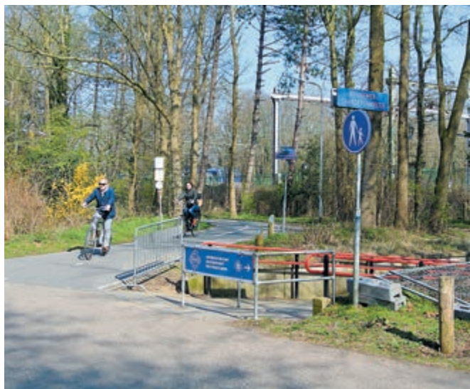
Fietsers rijden vanaf 't Princenboschpad langs het Kennemergaardetunneltje. De bebording is vernieuwd en het hekwerk bij de toegang van het tunneltje is weer herplaatst. Op de achtergrond rijdt een sprinter