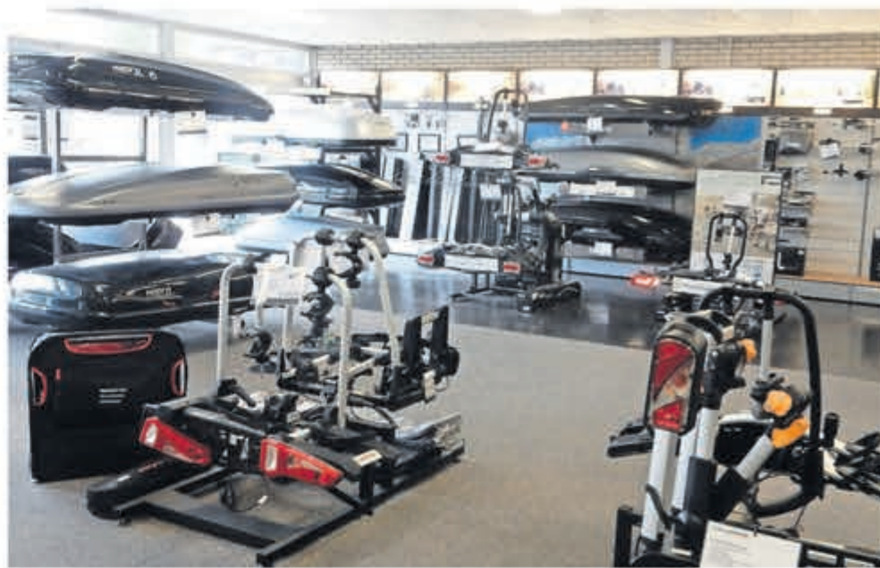
Dakkoffers en fietsdragers