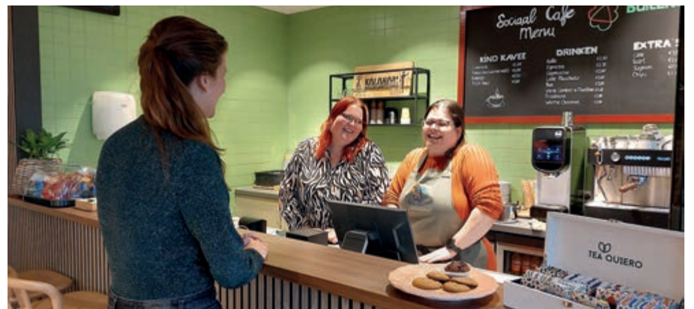
Arbeidsmatige dagbesteding in het sociaal café

De Cirkel - Maanbastion 476 – Velsbroek – in het pand van de Bibliotheek Velsbroek.