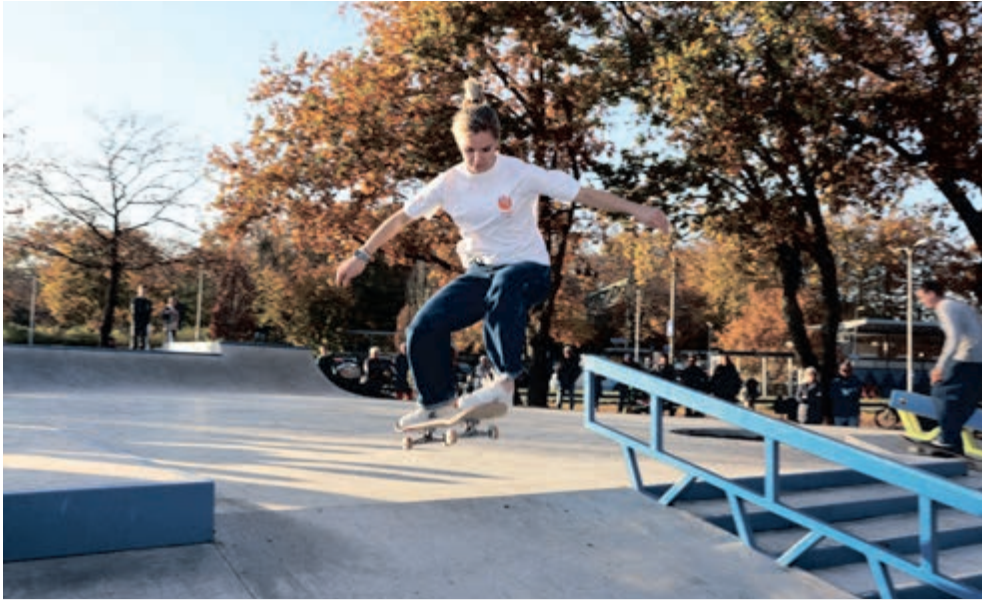
Olympisch skateboardster Roos Zwetsloot tijdens de opening van het urban sportspark.