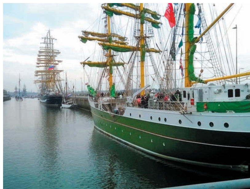
Drukke tijdens de Sail In woensdag 19 augustus.