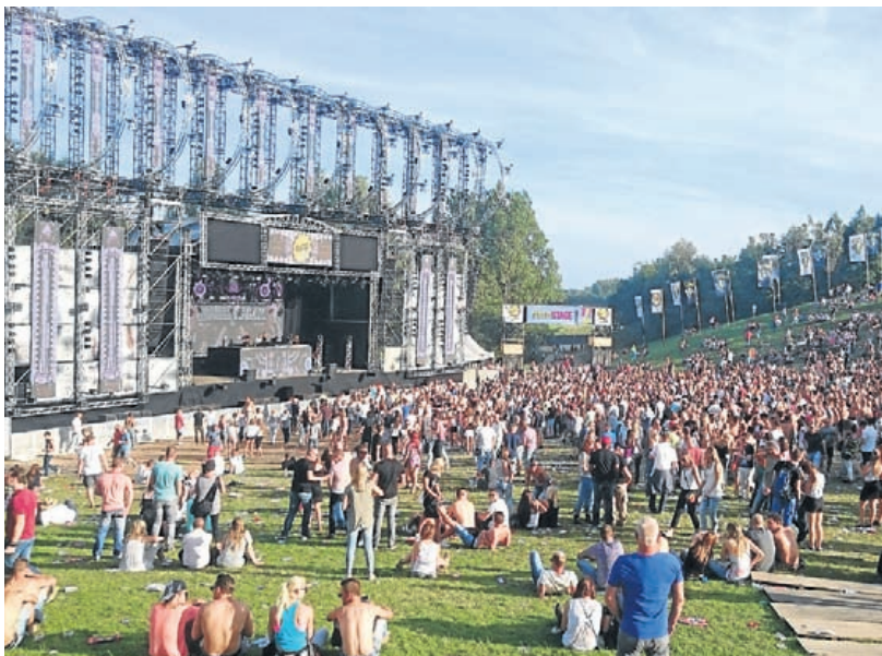
Het alom bekende Dance Valley is zaterdag vlekkeloos verlopen.

Via www.dutchvalleyfestival.com en www.spaarnwoude.nl en www.latinvillage.nl kunt u alle berichtgeving nalezen. Wie na het raadplegen van de websites nog vragen heeft of aanvullende informatie wil, kan bellen met het speciale telefoonnummer 020-4936050 van de organisatie, of een e-mail sturen naar info@udc.nl .