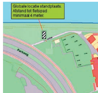
2: Velsen-Zuid, hoek Torenstraat/Parkweg op het grasveld