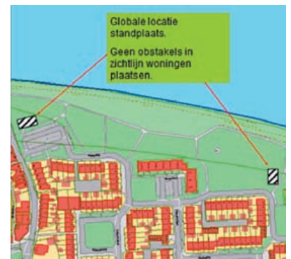
3: Velsen-Zuid, 2 locaties in het gras: Torenstraat en Ticht