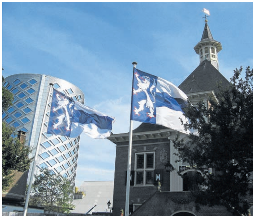
Het gemeentehuis van Haarlemmerliede en Spaarnwoude in Halfweg.

Heeft u vragen of opmerkingen aan de gemeente Velsen over de mogelijke fusie? Stel ze gerust. Dit kan via Facebook of communicatie@velsen.nl. Ook is er op dinsdag 17 mei tussen 19.30 en 21.00 in de burgerzaal van het gemeentehuis gelegenheid om vragen te stellen aan raadsleden en collegeleden.