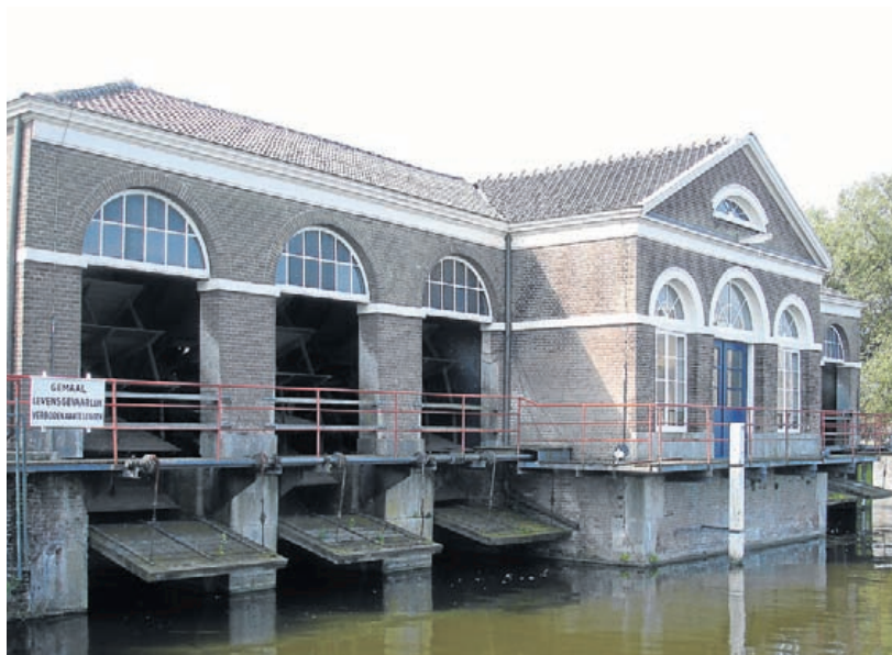
Cultureel erfgoed van Haarlemmerliede en Spaarnwoude: Museum Stoomgemaal Halfweg.