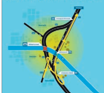
Route Alkmaar - Velsbroek