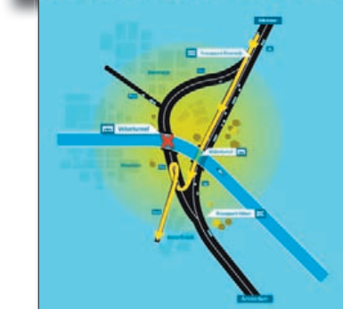
Route IJmuiden - Beverwijk