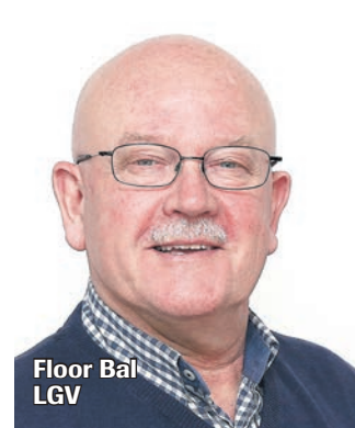
Floor Bal LGV