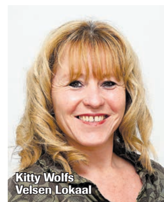
Kitty Wolfs Velsen Lokaal