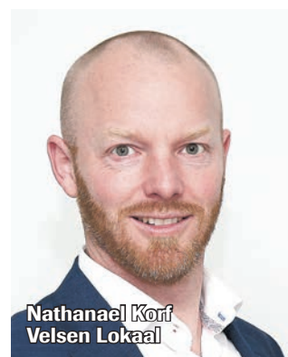
Nathanael Korf Velsen Lokaal