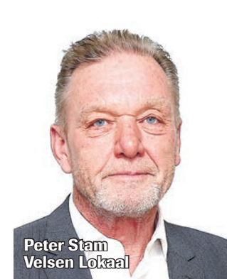
Peter Stam Velsen Lokaal