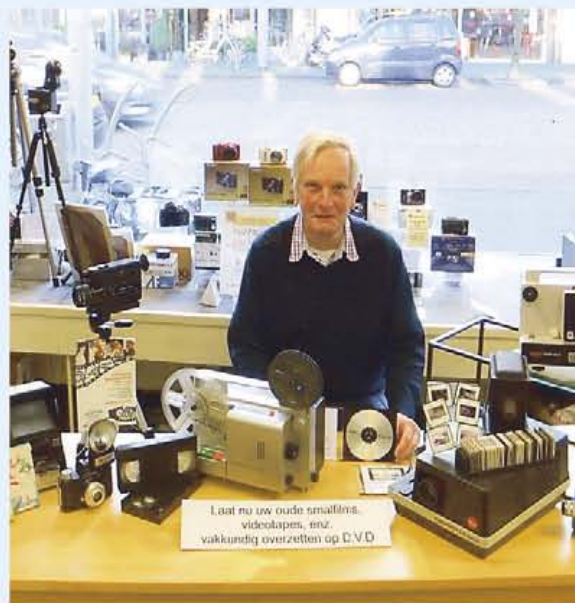
Laat nu uw oude smalfilm, videotapes, enz. vakkundig overzetten op DVD

Kennemerlaan 108, 1972 IJmuiden Tel: 0255 - 535898 / 06 - 22595608 verkooyen-stoffering@quicknet.nl