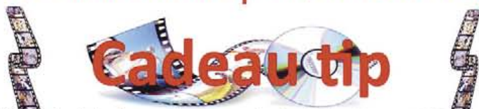
FOTO LOEK ANDERSON IN BEELD Oude familiebeelden op DVD of Harde schijf

Bij Foto Loek Anderson kunnen oude familiebeelden op DVD – Harde schijf – USB stick worden overgezet.