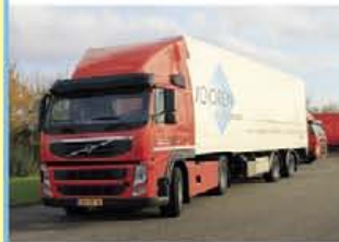
Jooren transporten B.V. Machineweg 4 1191 LC Ouderkerk a/d Amstel