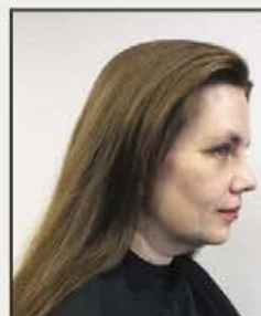
Zo zat het...

Een Sunglitz behandeling kost €24,50 (excl. overige behandelingen)