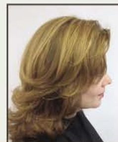
...en zo zit het!