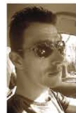
Fam. van Son