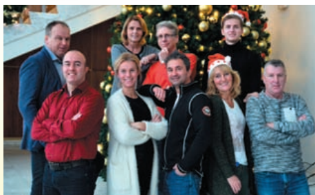
Sportloket Velsen wenst u een voorspoedig en sportief 2017