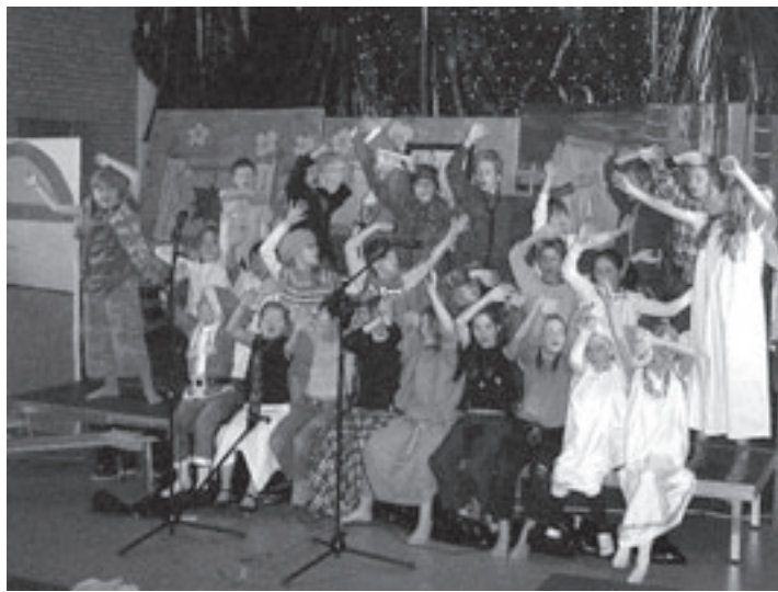
Groep 6 van basisschool de Toermalijn speelde 'Wat een nacht'

Velsen-Zuid - Op de Amsterdamseweg heeft een inwoner van Spaarndam vrijdag zijn auto aan de kant gezet rond 23.50 uur, nadat hij een rare 'tik' hoorde in zijn auto. Toen de man uit zijn auto stapte, bleek de auto vlam te vatten. De bestuurder bleef ongedeerd en de auto moest worden weggesleept.