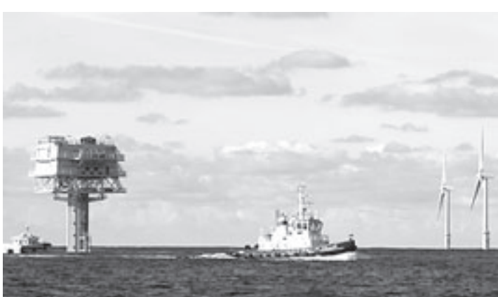
Het Offshore Windpark Q7 in de Noordzee

12.00 tot 18.00 uur (op donderdag tot 21.00 uur). De entreprijs bedraagt 2,75 euro. Dat is inclusief schaatshuur. Van dit bedrag gaat 25 cent naar het Fonds Gehandicapten-sport. Van maandag tot en met vrijdag, van 10.00 tot 12.00 uur, kunnen de basisscholen uit directe omgeving van Velsersbroek gebruik maken van de schaatsbaan om bijvoorbeeld te schoolschaatsen. De kunstschaatsbaan van 300 vierkante meter is mogelijk gemaakt door een investering van de ondernemersvereniging van Winkelcentrum Velsersbroek. Corio Nederland Retail, vastgoedbelegger en manager van Winkelcentrum Velsersbroek, schafte de schaatsbaan aan om in meerdere winkelcentra in te zetten.