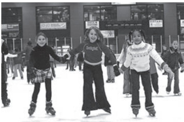
De kunstschaatsbaan Velsersbroek meet 300 vierkante meter

de families bezoek. De familie Asdam krijgt bezoek van een rijk man. De familie Berenschot krijgt bezoek van een zwerver. Wat deze rijke man en zwerver nu eigenlijk willen? Tja; ze hadden eigenlijk in de stadsschouwburg moeten optreden dan hadden veel meer mensen de kerstboodschap begrepen. De complimenten voor het spelen van deze moeilijke musical met veel pittige liedjes en ingewikkelde scènes zijn absoluut op zijn plaats. Een mooie herinnering om nooit te vergeten.