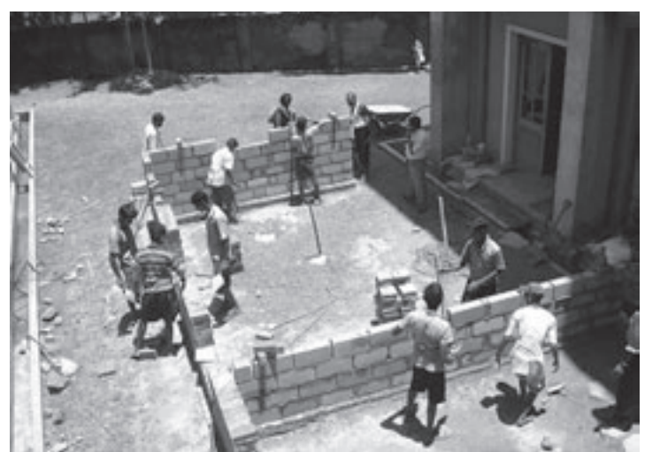
Jongeren in Galle krijgen les in metselen, zodat zij kunnen helpen bij de wederopbouw van Galle

Deze en andere onderwerpen zijn te zien en te horen in de eerste uitzending op 28 december om 18.00 uur. Op zaterdagavond 29 december en maandagavond 31 december zijn de herhalingen om 18.00 uur. Kijkers kunnen deze uitzendingen van Velsen Centraal onder de regie van Edwin Woning zien via de Velsers TV-kabel op S12++ (frequentie 240 MHz). Nadere bijzonderheden staat op de teletekstpagina 331 van Seaport TV.