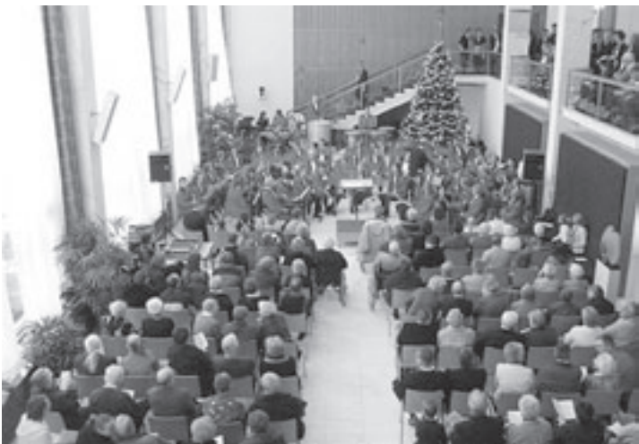
Het concertorkest van de IJmuider Harmonie

Apotheek Santpoort-Zuid: Vanaf 18.00 uur heeft ALTIJD dienst: Centraal Apotheek, Gedempte Oude Gracht 103-105, Haarlem, tel. 023-