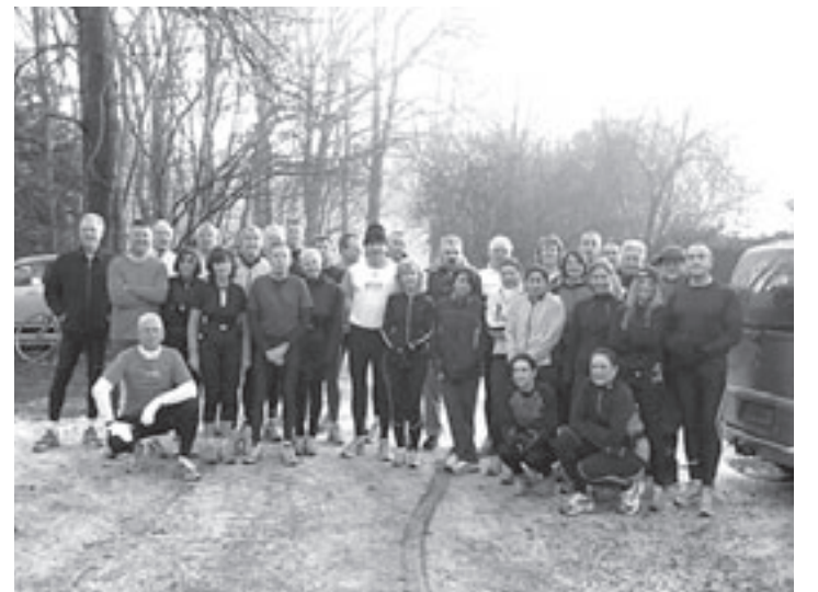
De lopers van sportcentrum Santpoort aan het begin van de oudjaarsloop 2007