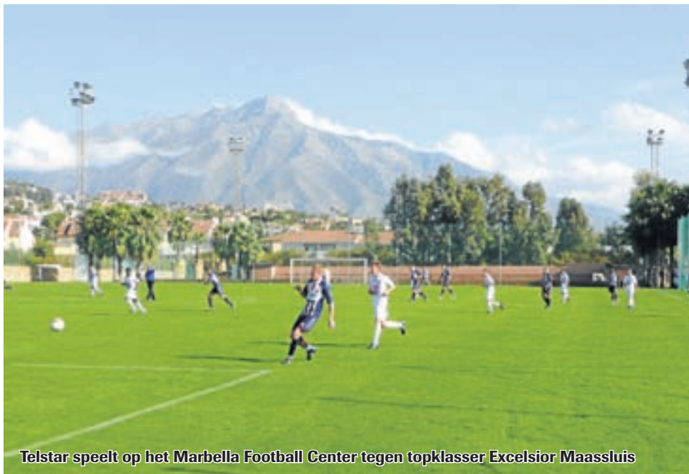
Telstar speelt op het Marbella Football Center tegen topklasser Excelsior Maassluis